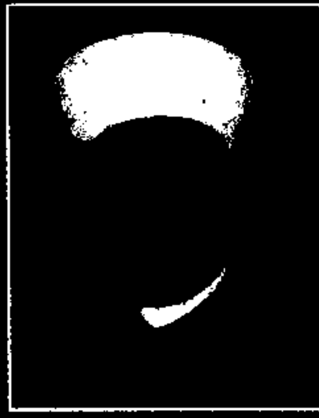
الشيخ الدكتور يوسف المرعشلي