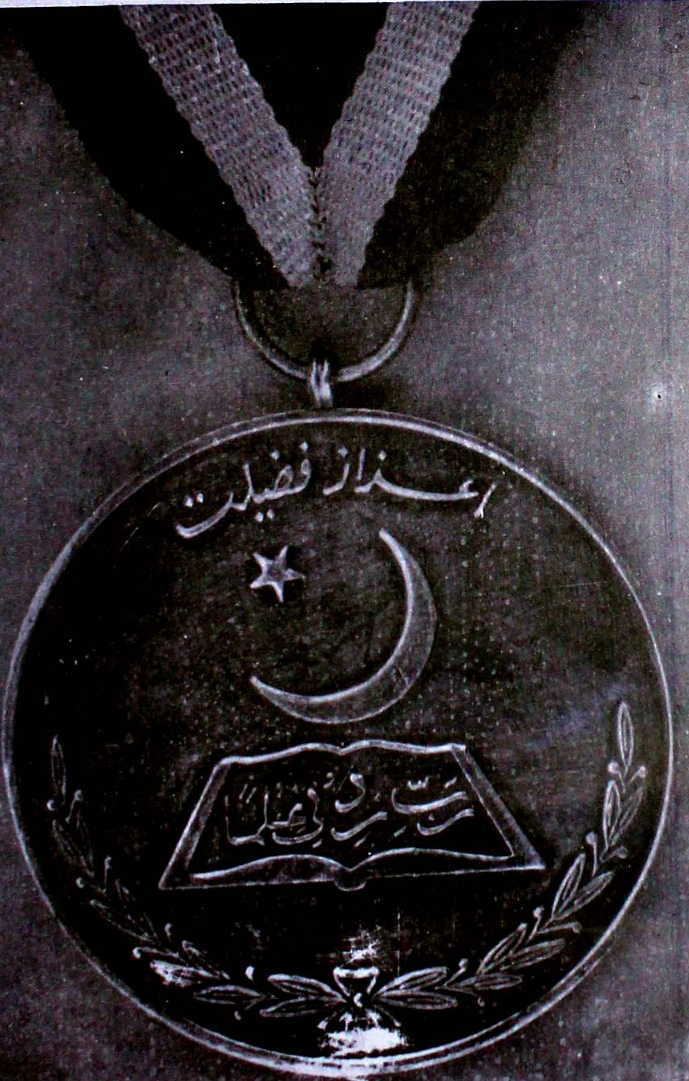
عسکر اعزازِ فضیلت، پیش کردہ حکومت پاکستان، اسلام آباد (۲۳ اگست ۱۹۹۳ء)