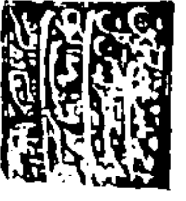
صورة الصفحة الأخيرة من نسخة (ص)

بسم الله الرحمن الرحيم الحمد لله رب العالمين والصلاة والسلام على سيدنا محمد وآله وبعد