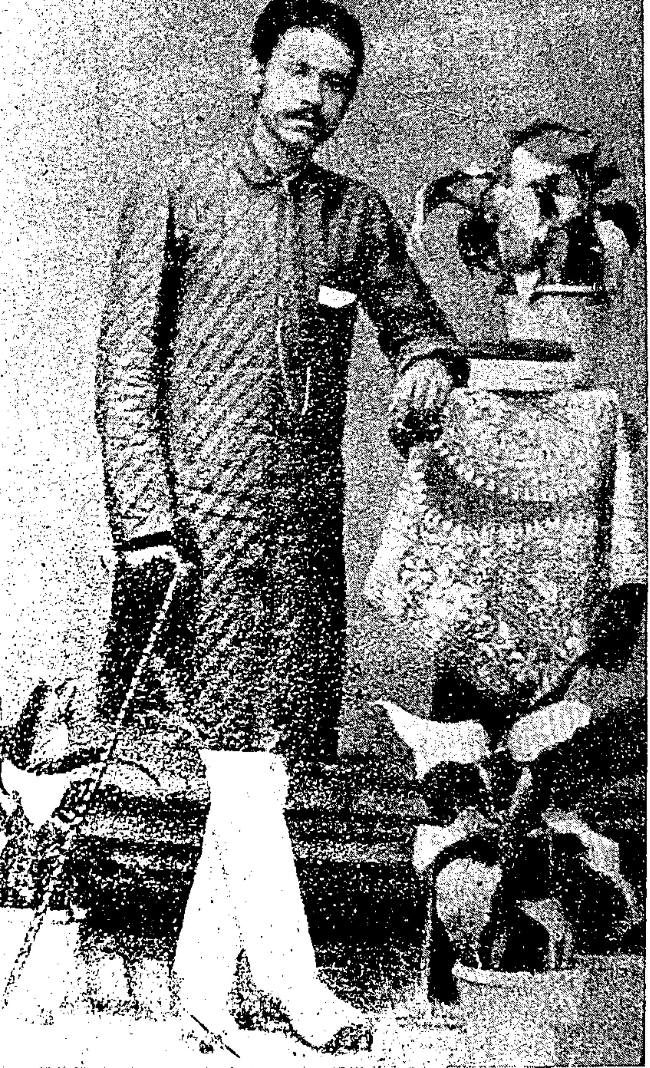
شیخ صاحب مرحوم ۱۵، ۱۶ برس کی عمر میں