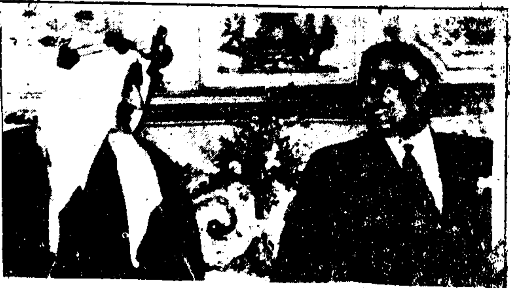
شاہ فیصل اور کرنل جمال عبدالناصر