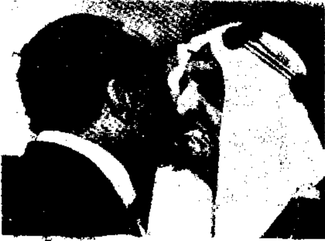
شاہ فیصل اسادات مرحوم کے ساتھ