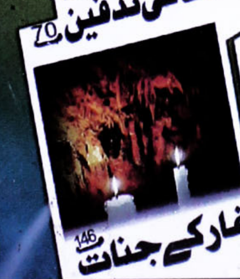
غار کے جنت 146