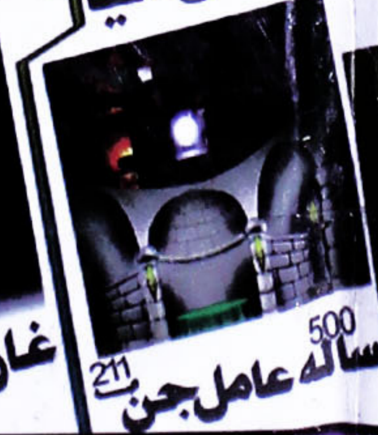
500 سالہ عامل جن 211