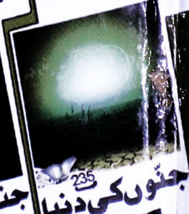
جنتوں کی دنیا 235