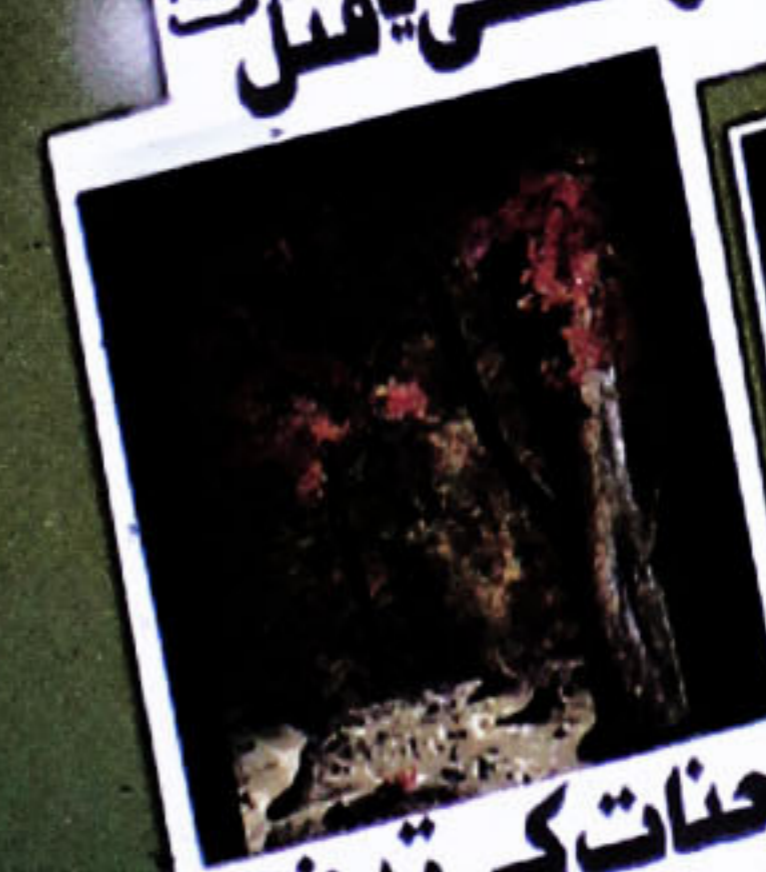
جنت کی تدفین 70