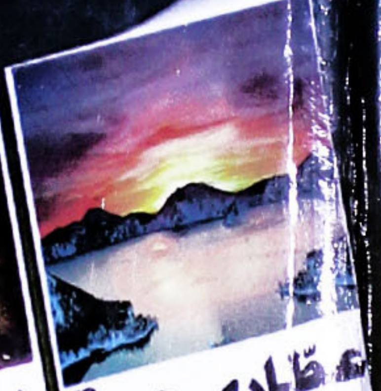
مظاری جن 72