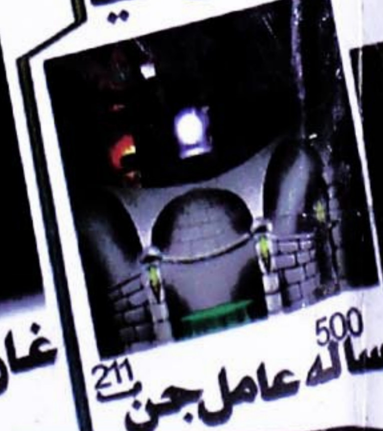
211 500 سالہ عامل جن