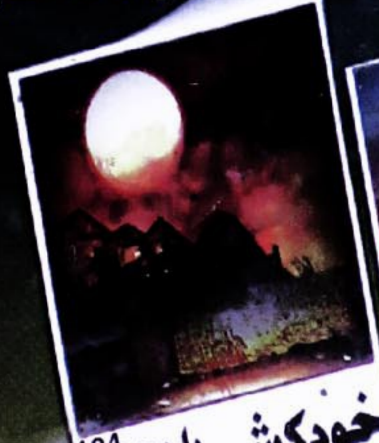
134 خودکشی یا قتل