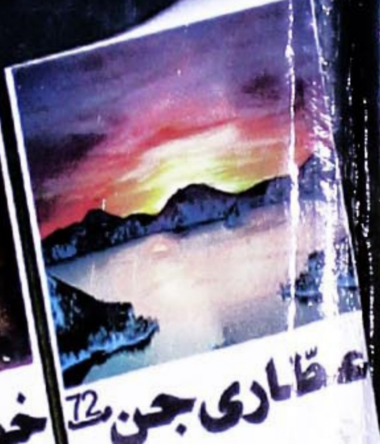
72 عظاری جن