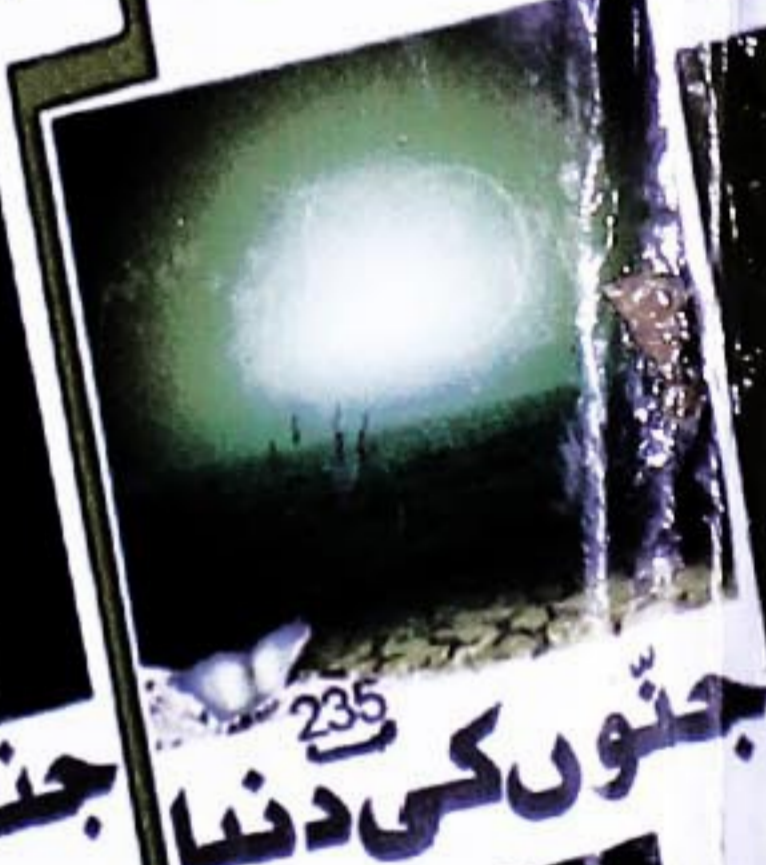
235 جنوں کی دنیا