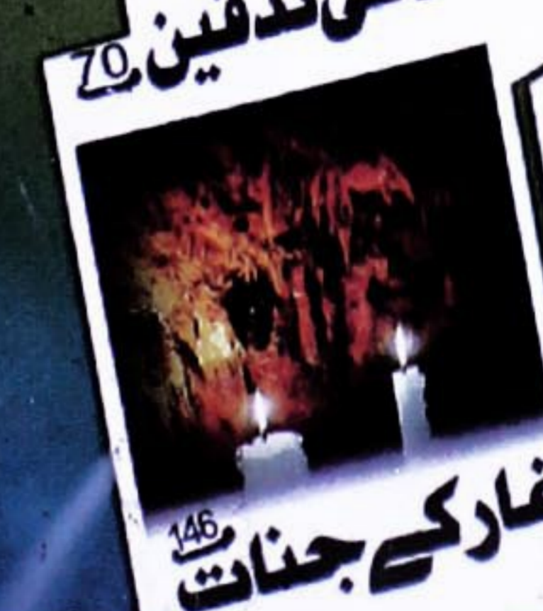
146 غار کے جنات