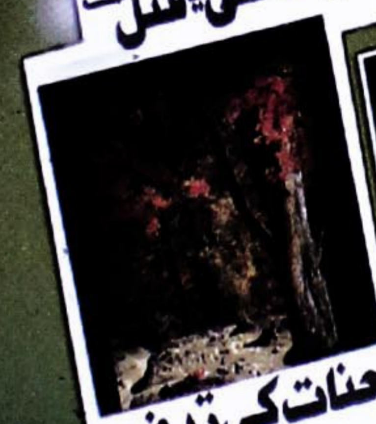
70 جنات کی تدفین