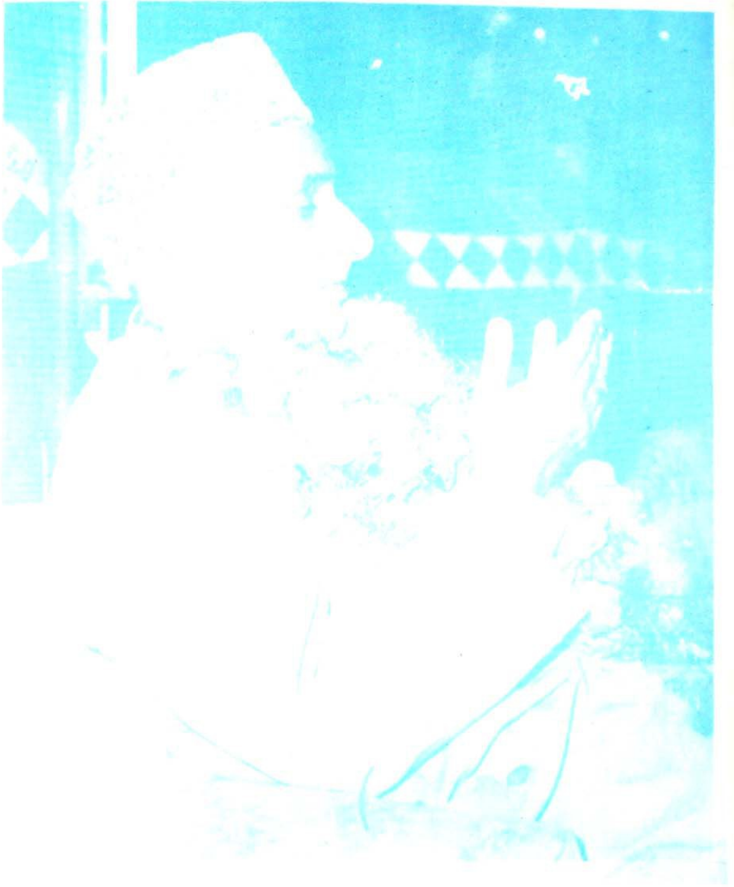
حضرت پير بادشاه، خواجہ پير گل حسن صديقي نقشبندي قدس سرہ، متون سجاده نشين درگاہ عالیہ لواري شريف