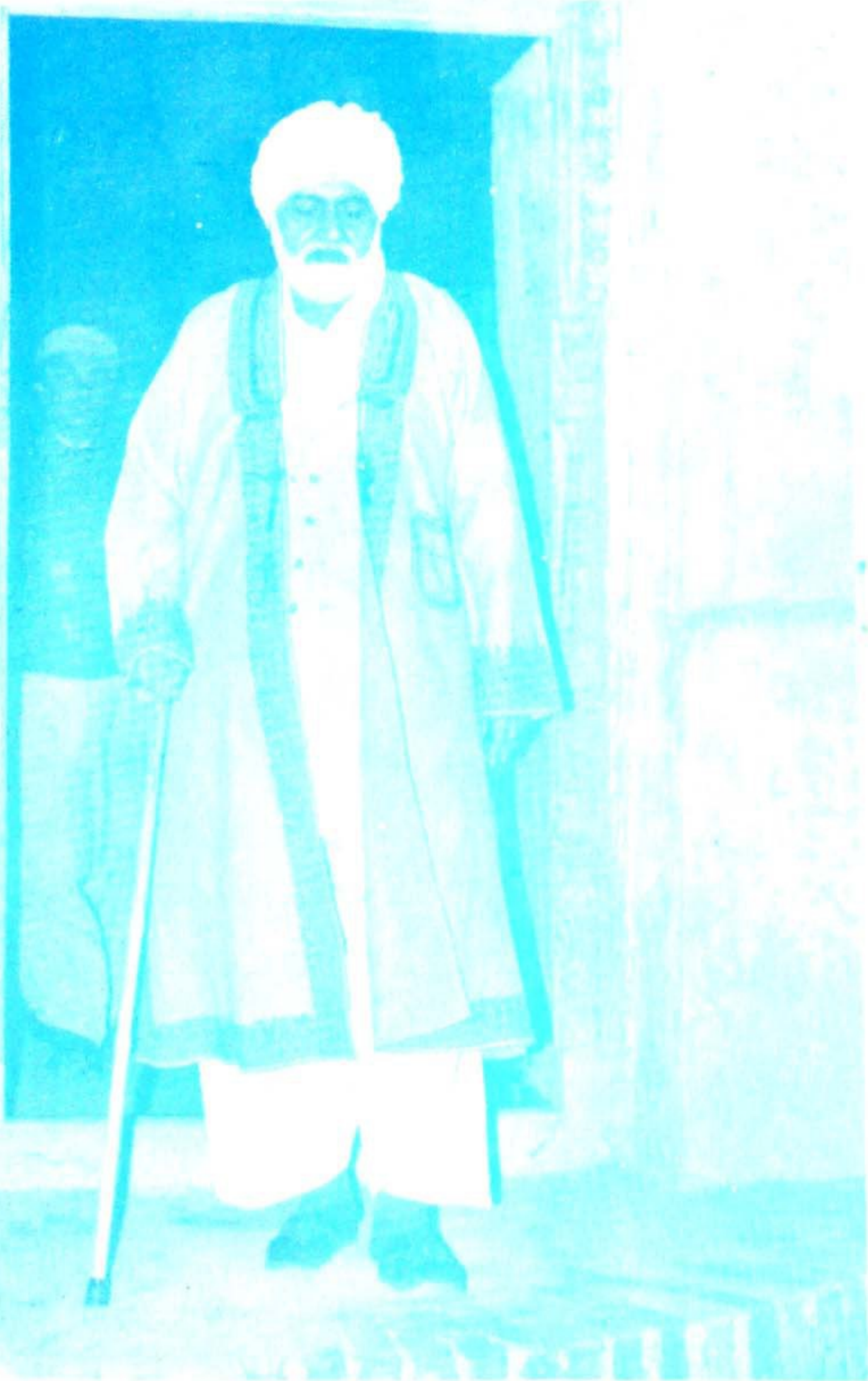
حضرت قبلہ سائین پیر فہض محمد نقشبندی مدظلہ العالی سجادہ نشین درگاہ عالیہ لواری شریف