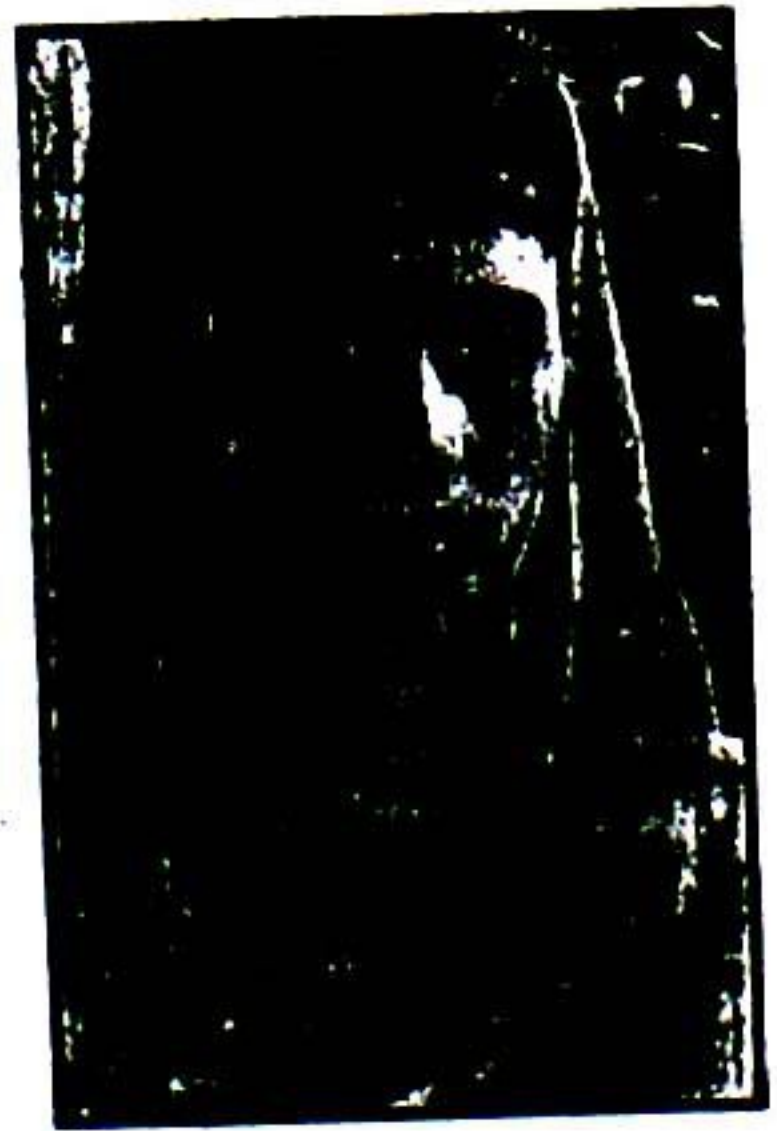
زیب النساء اثر