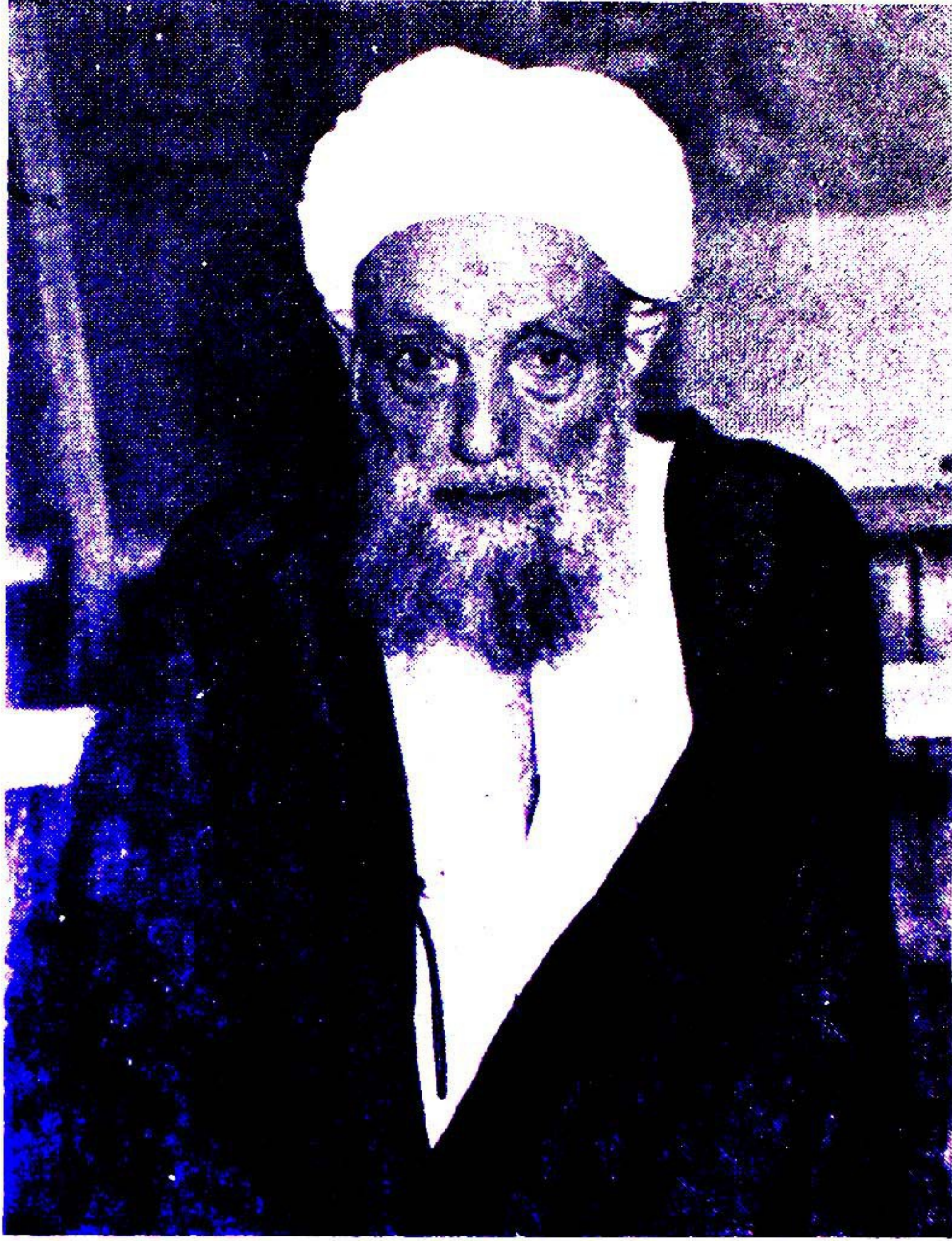
تصوير والدى العلامة المؤلف .