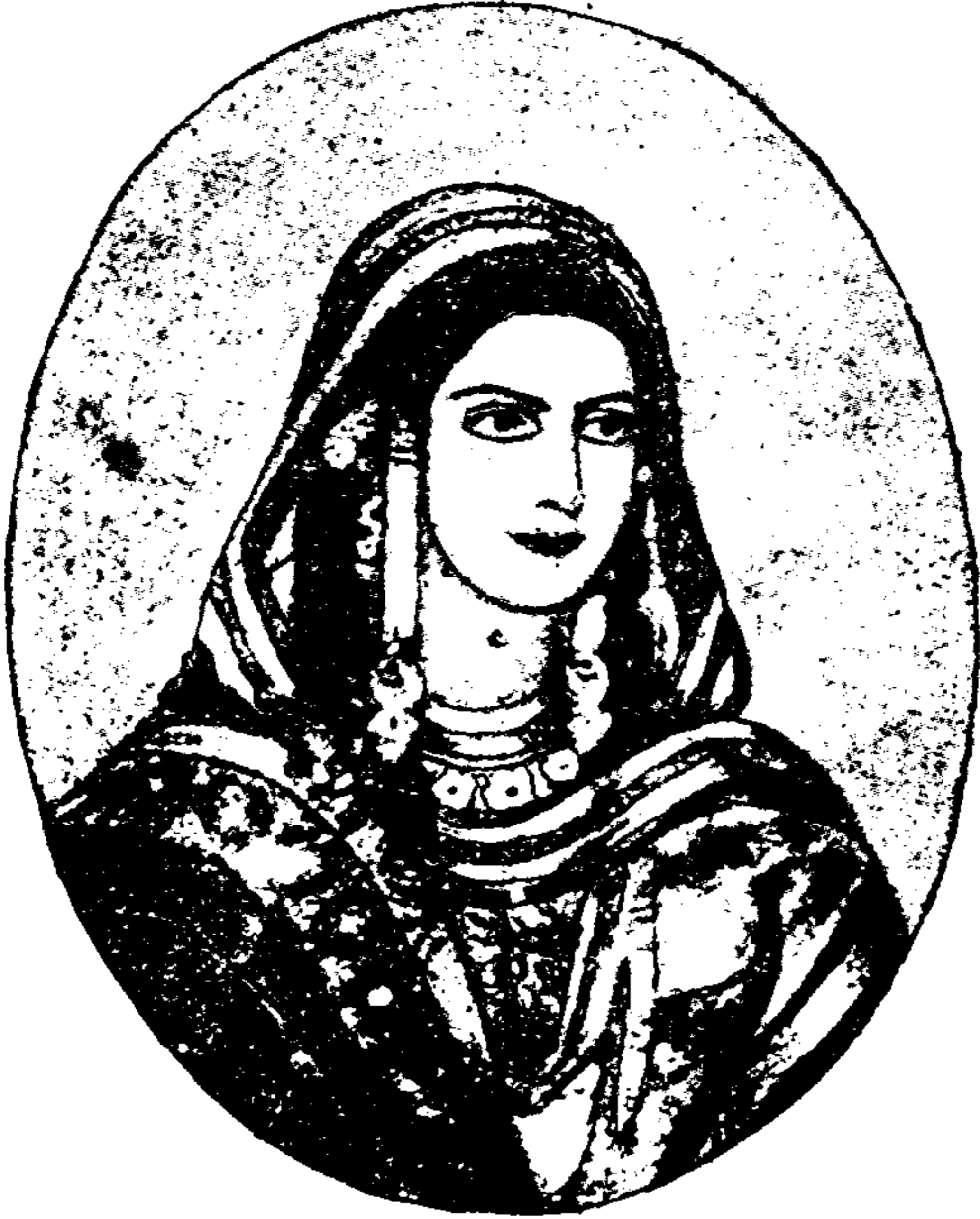
شہنشاہ بابہ کی بیٹی۔ گل بد۔ بیگد