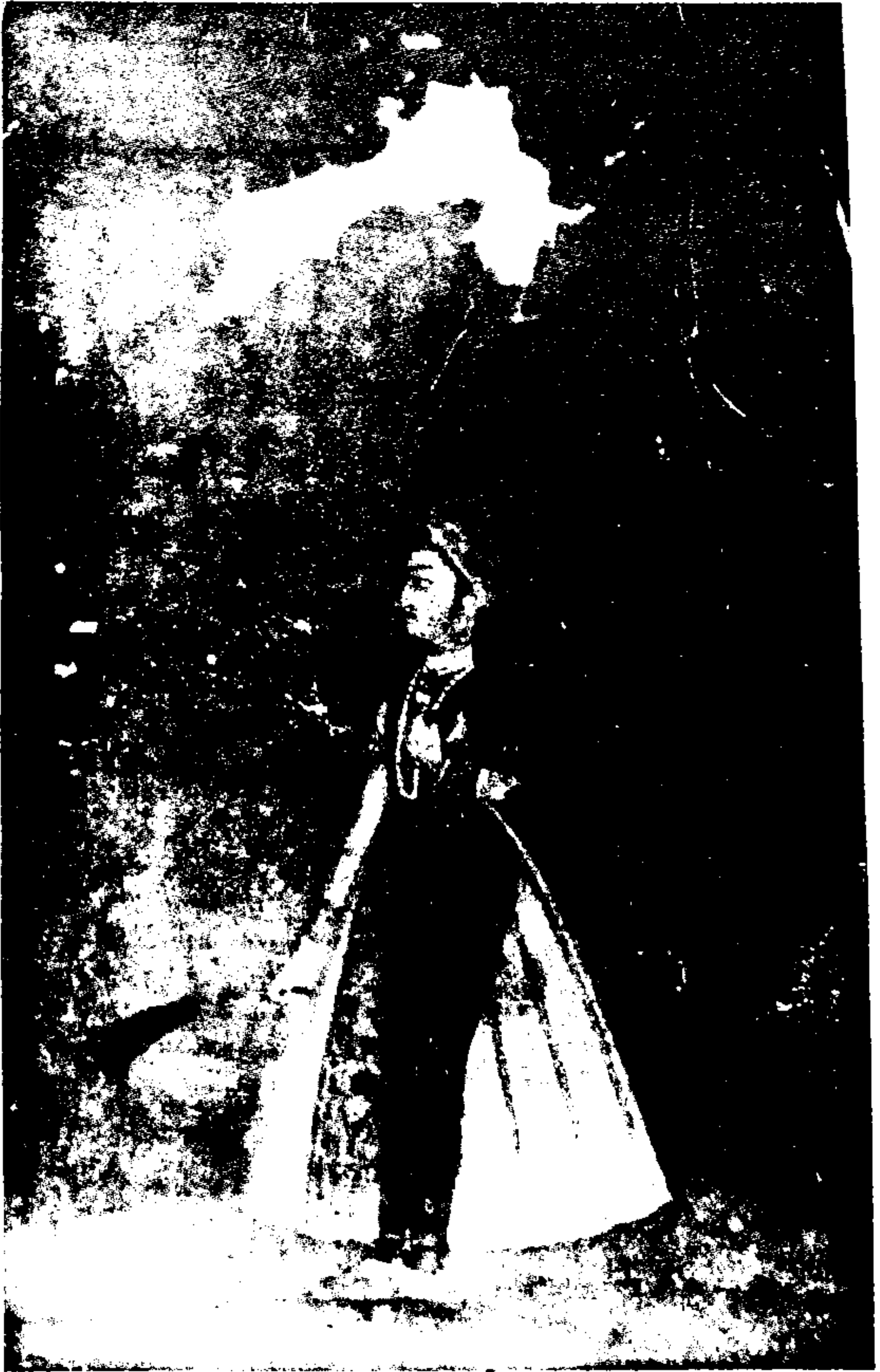
ریت ایکہ میاں ان فطرت سے لیا