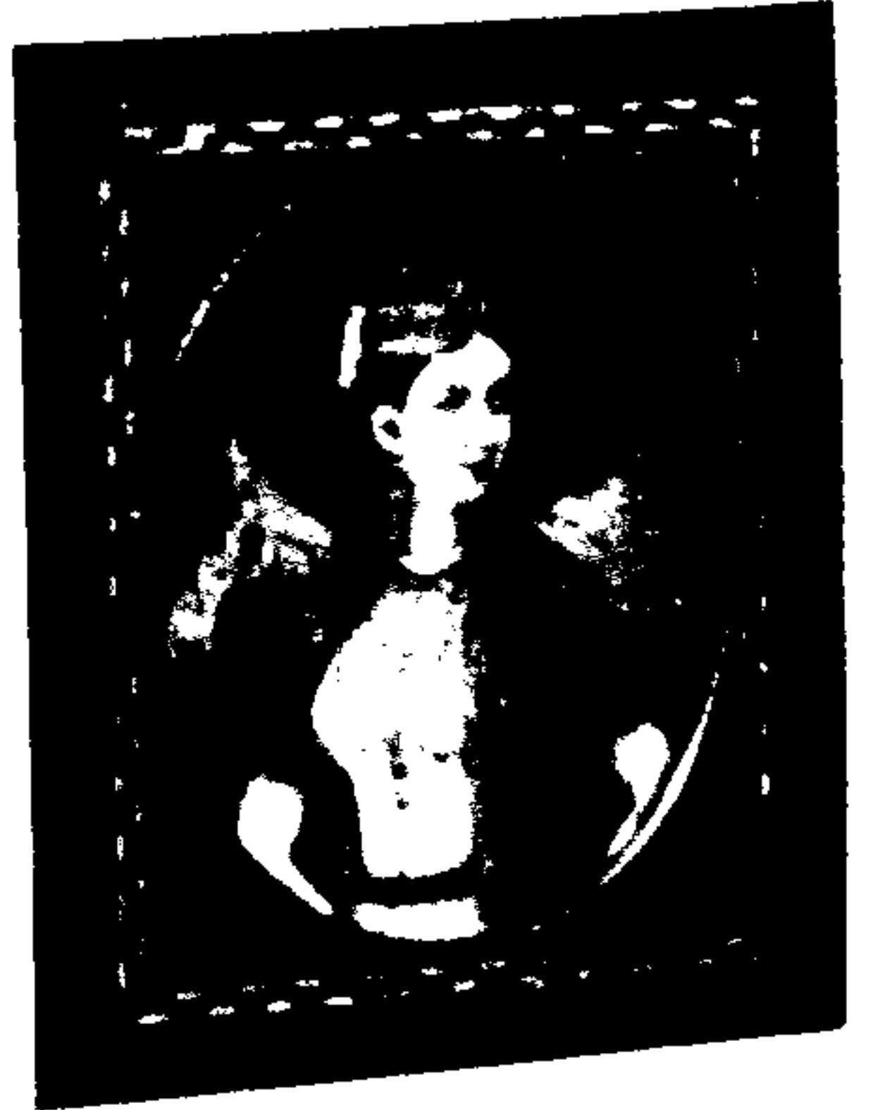
شرف افزا بانو