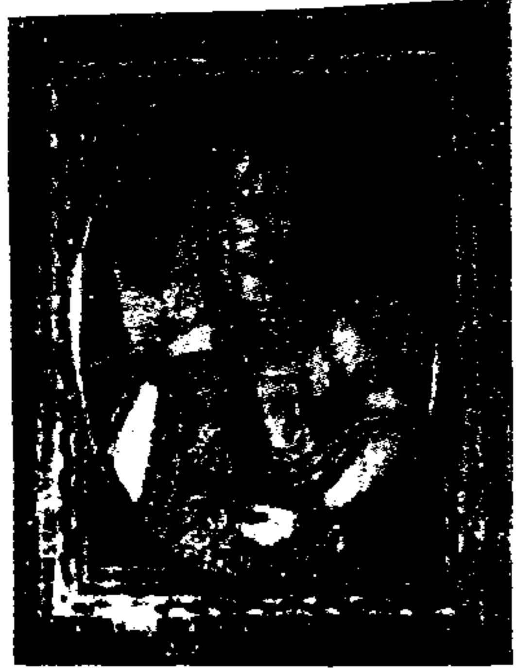
رانی چندرما (جودھا بانو)