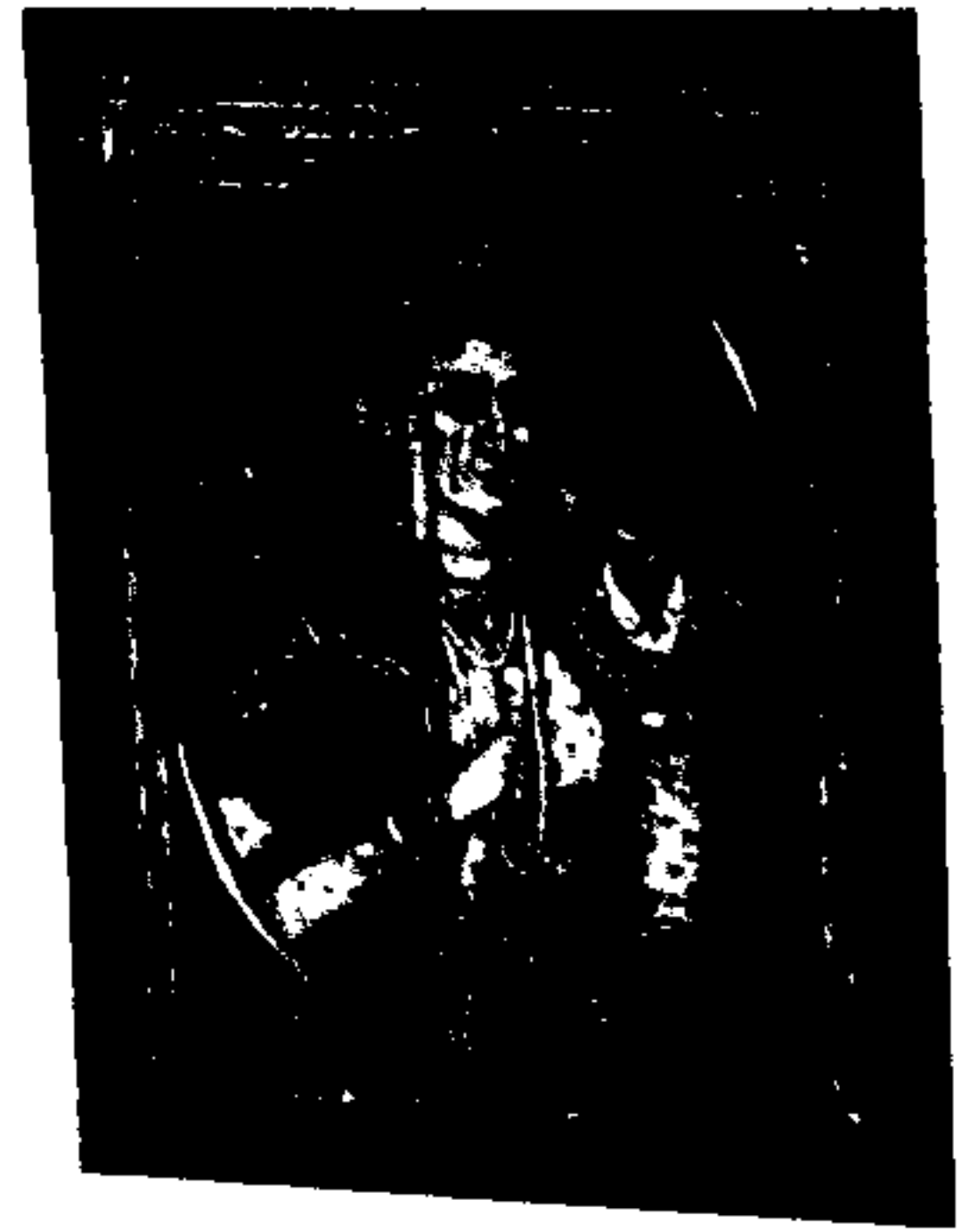
نور جہاں بیگم