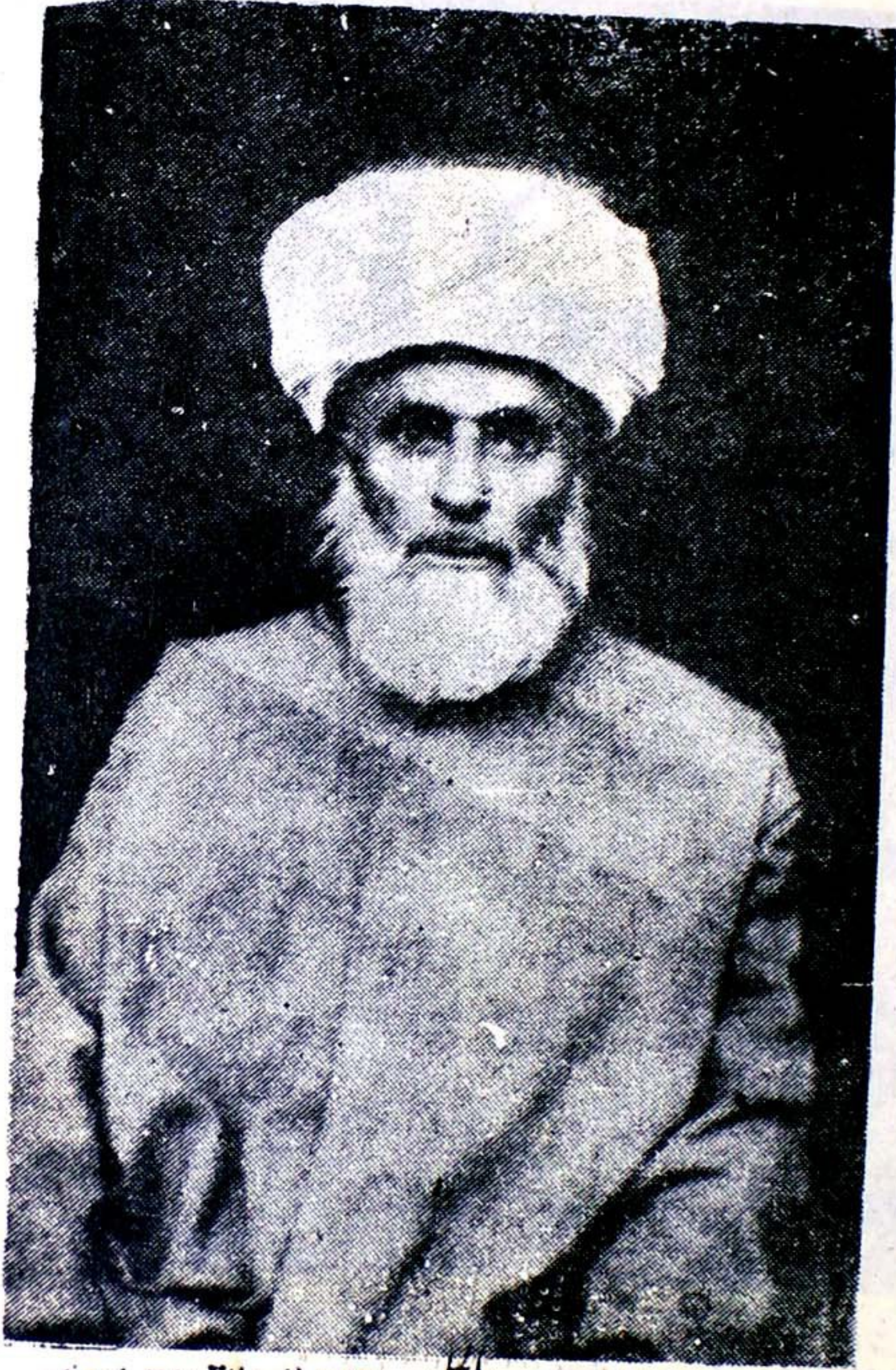
سماحة العلامة الشيخ محمد عيسى الحلبي سابق قاضي القضاة شاماً