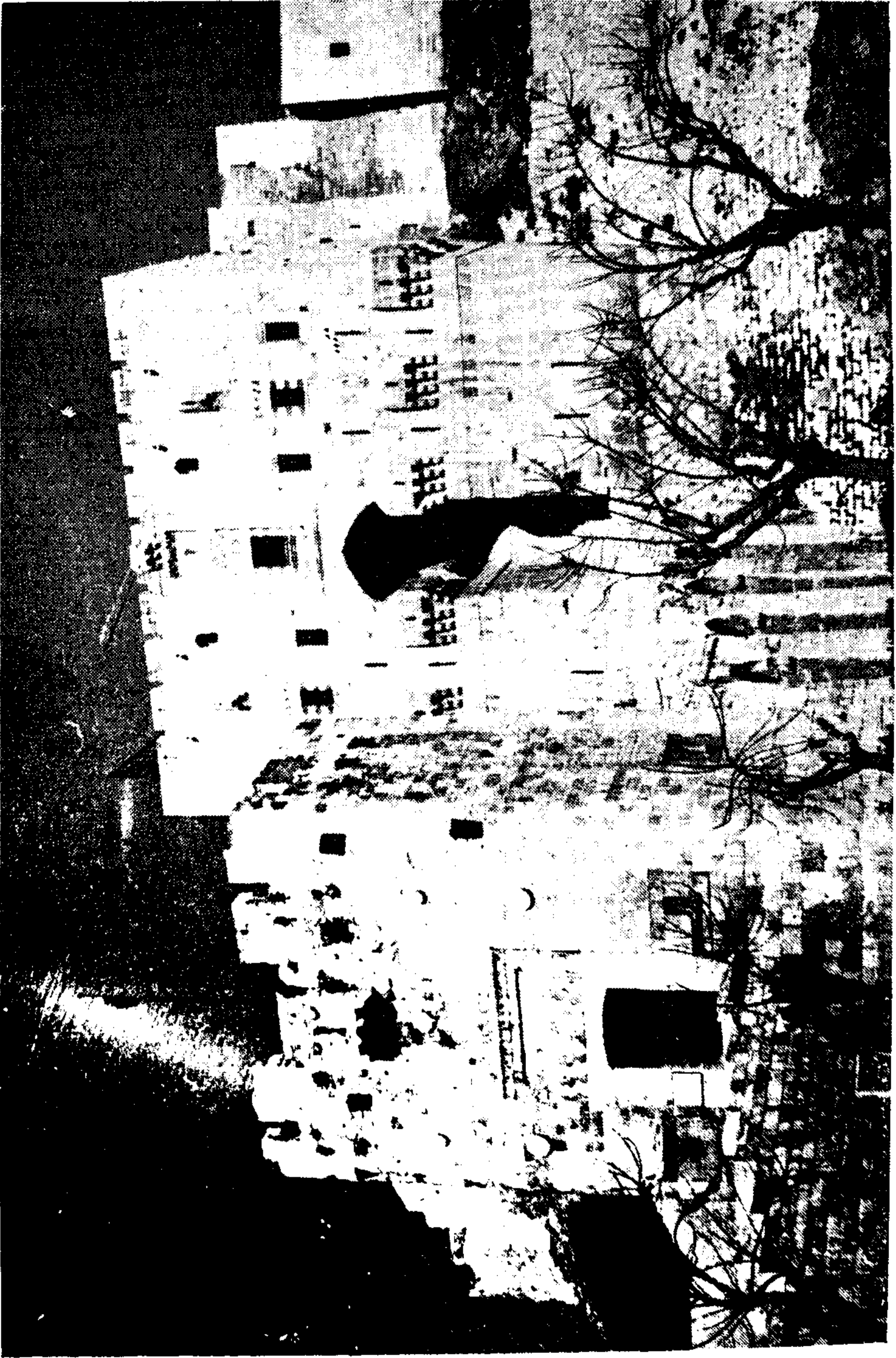
تصویر ۳ - زندان سهروردی در حجاب (سوریہ)