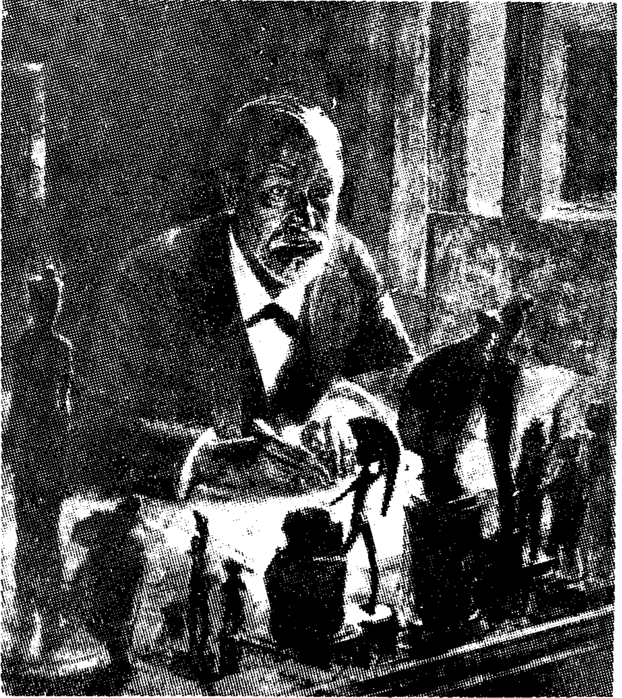
پروفیسر سمنڈ فریوڈ