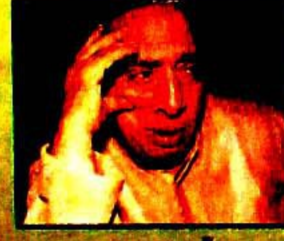
تعمیر اور ترقی ہمیشہ ڈی مادی جاتی ہے جنگ