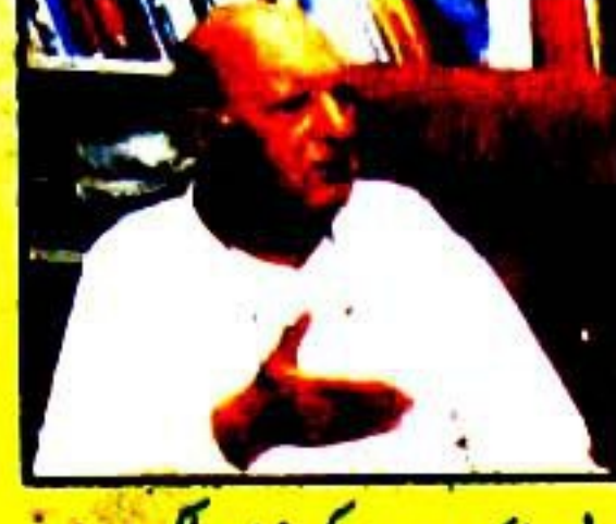
ادبی جائزہ میرٹ کی بنیاد پر لکھتا ہوں ڈاکٹر اور سید