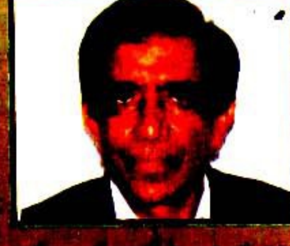
پاکستان کی صحافتی تاریخ کے ہر سوال کا مدلل جواب موجود ہے جیب رضوی