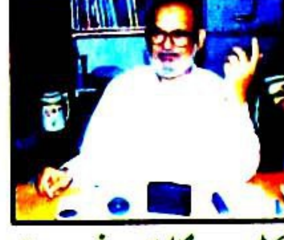
بھٹو سے پننگ لیا اور سر خر و ہوئے ادووا انجسٹ