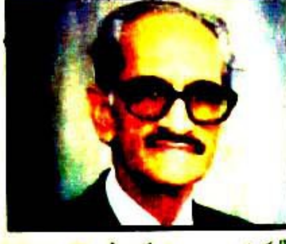
لم کی طرح صحافت میں بھی رو نہ رہنا کا ظہر ہے طیلسی