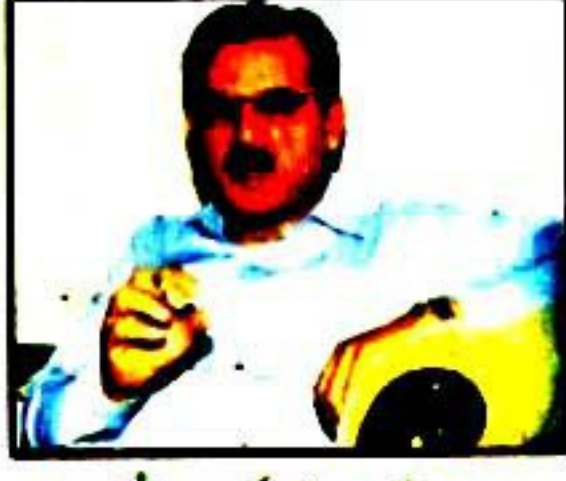
اپنے اندر کے ضیا شاہد کو مرنے نہیں دیا خبریں