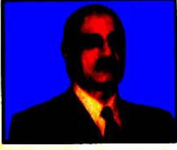
صدر پرویز مشرف سے محبت وطن پاکستانی ہیں ڈاکٹر صدیق محمد