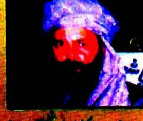
پاکستان کی صحافتی تاریخ کے ہر سوال کا مدلل جواب موجود ہے خبریں