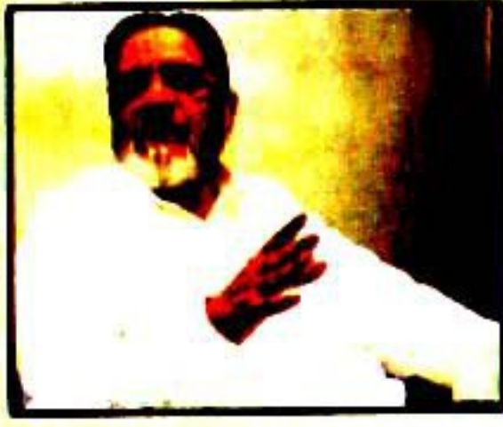
بکس اور سٹی فیری کی سوانی روز میں شری میں ہوا ہوتا مصطفیٰ صادق