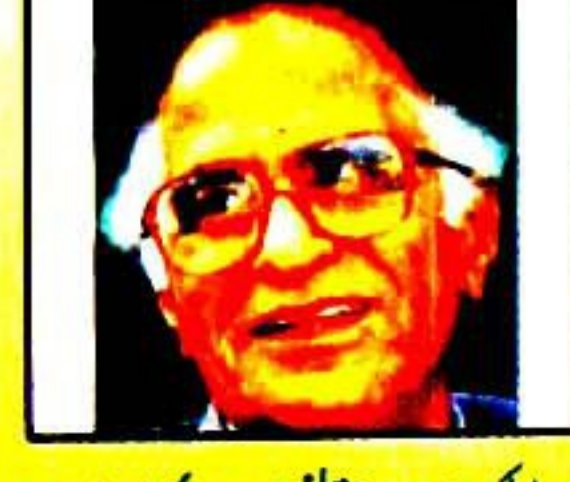
پورا ملک میرے مخالفوں سے بھرا ہوا ہے محمد عیسیٰ