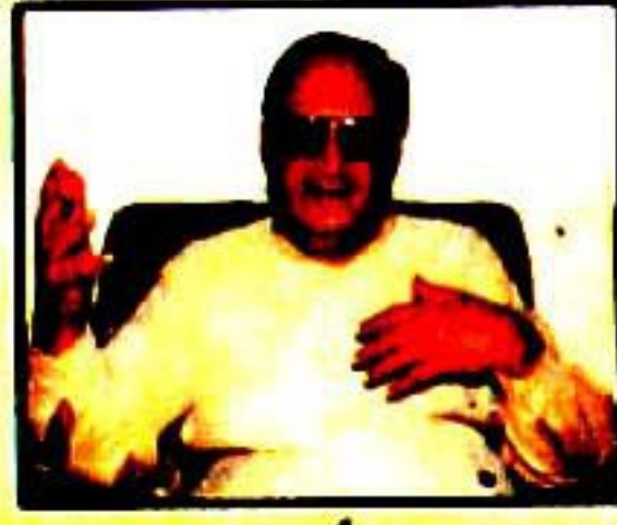
کالم نگار اور ایڈیٹر حکومت کو بیوقوف بنا کر جنگ