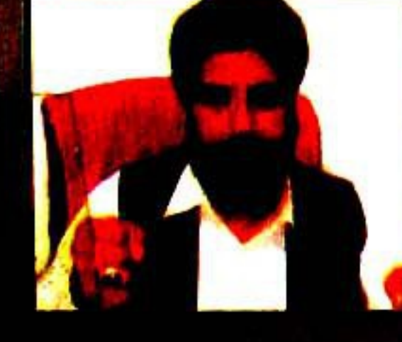
پاکستان کی صحافتی تاریخ کے ہر سوال کا مدلل جواب موجود ہے مارف ظلمی