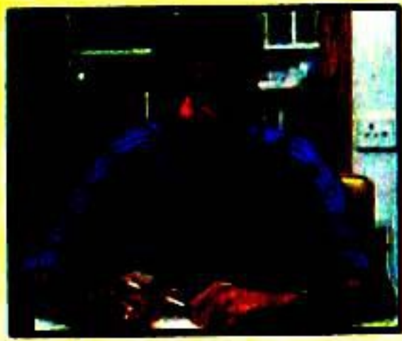
ڈی اخبارات سرکاری چہرے پر لگتے ہیں مارف ظلمی