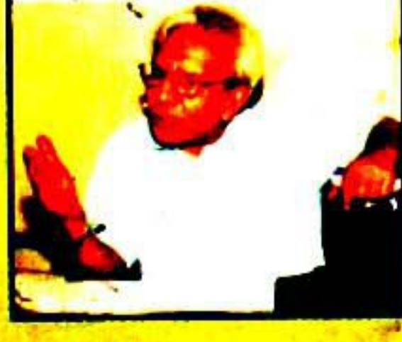
سیاستدانوں کی موجودہ حالت میں کوئی یزید نہیں عہاس المہر