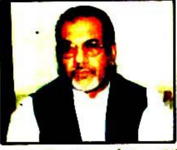
"پاکستان مجھے اللہ تمیماں نے دیا جیب رضوی