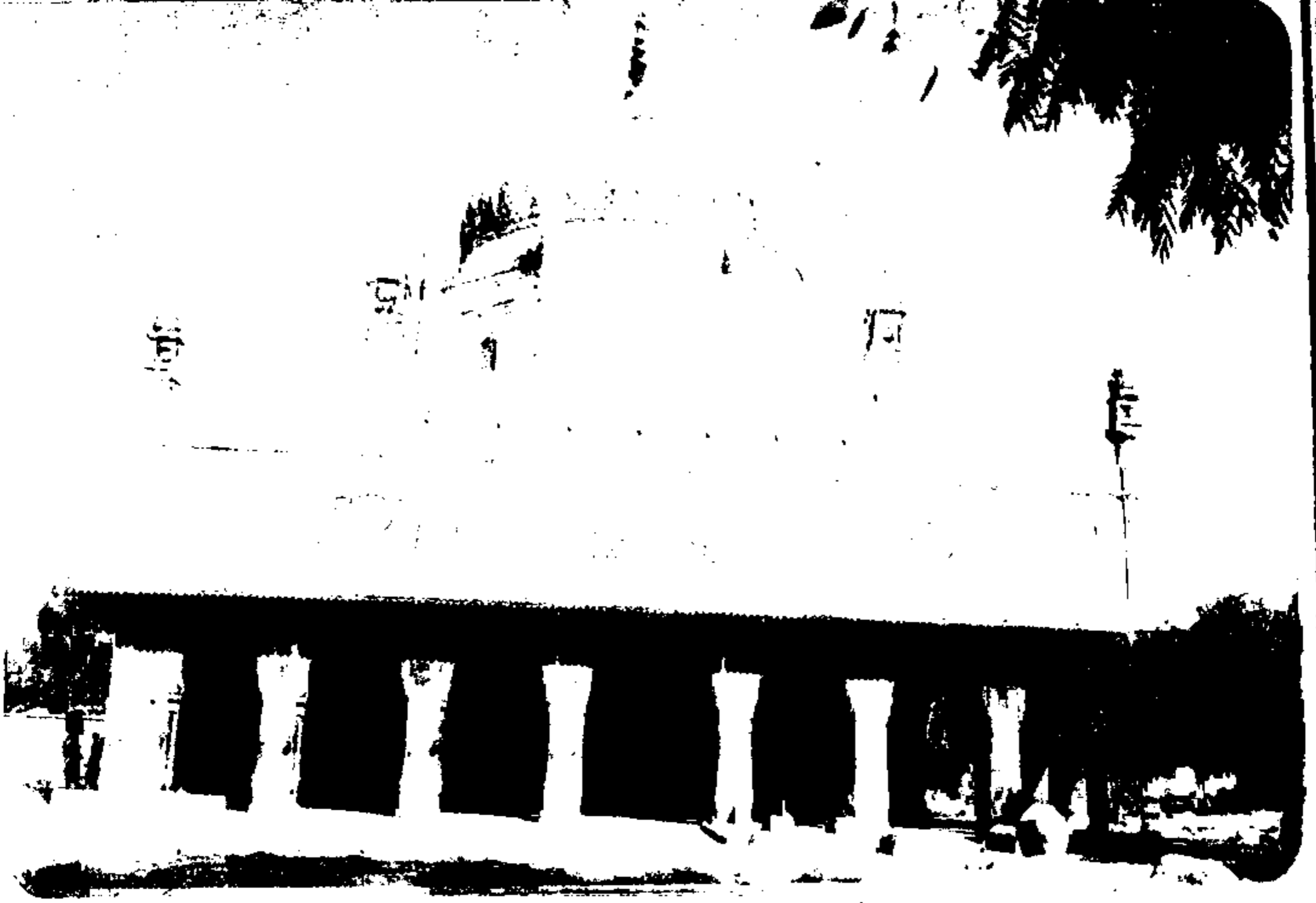
۱- مزار مبارک مخدوم عبدالرشید حقانی واقع قصبہ مخدوم رشید ضلع ملتان