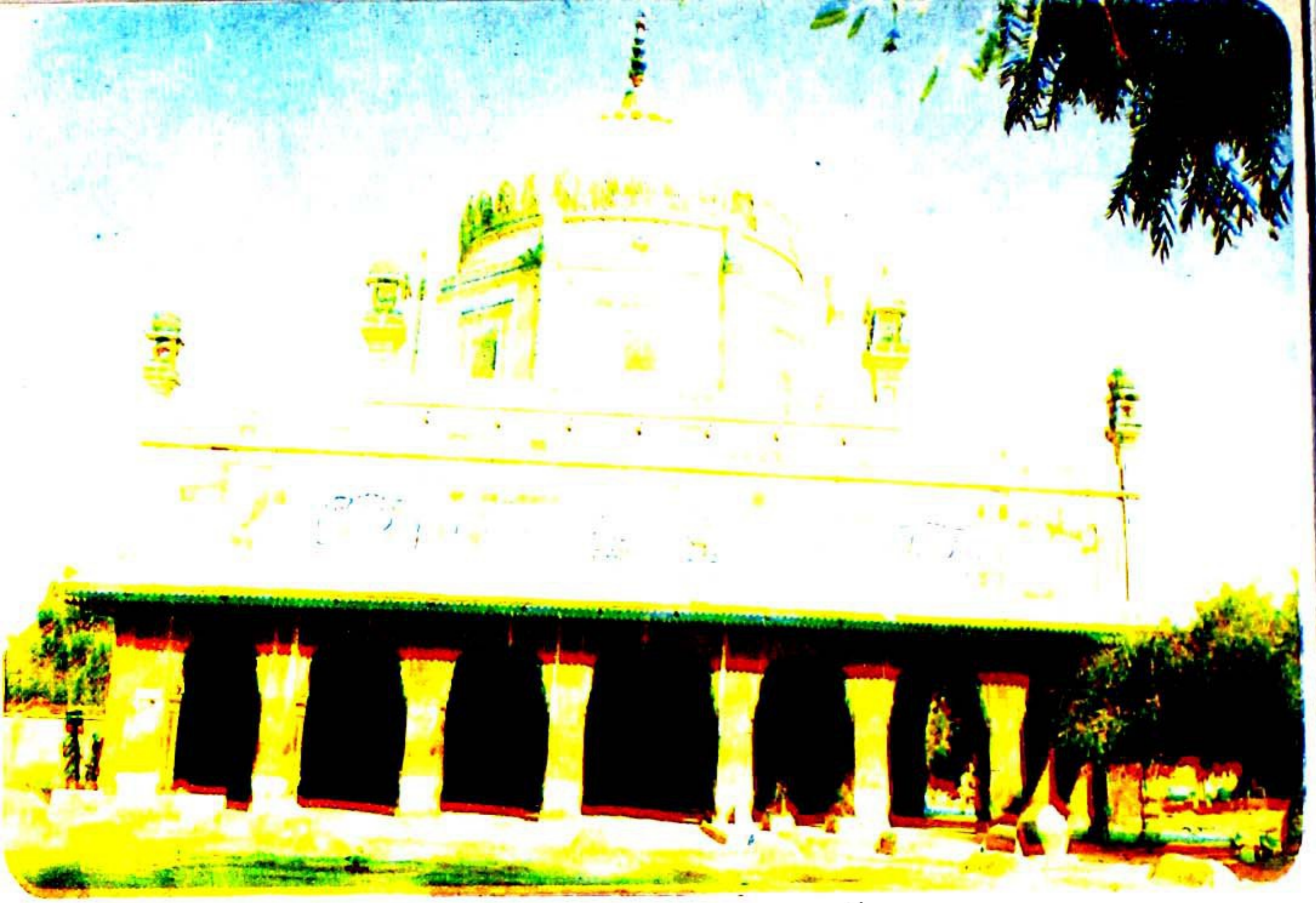
۱- مزار مبارک مخدوم عبدالرشید حقانی واقع قصبہ مخدوم رشید ضلع ملتان