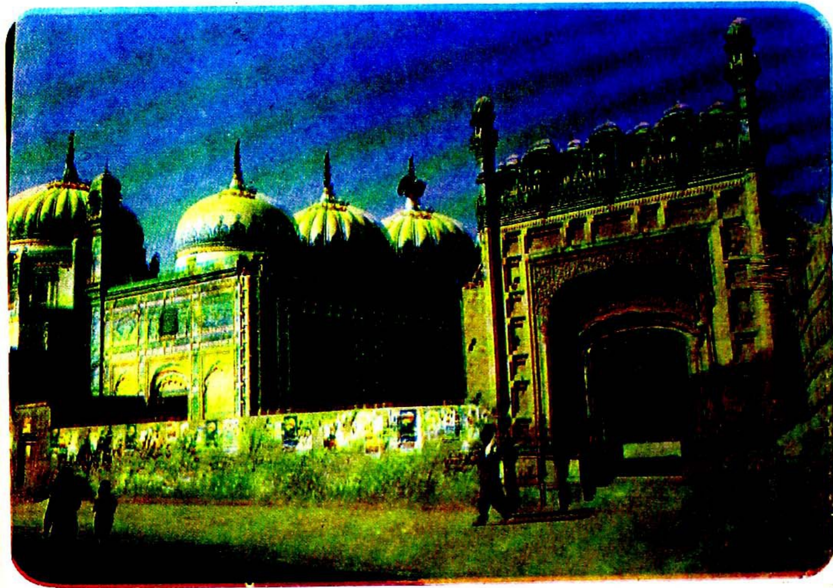
۲- مسجد حقانیہ قصبہ مخدوم رشید