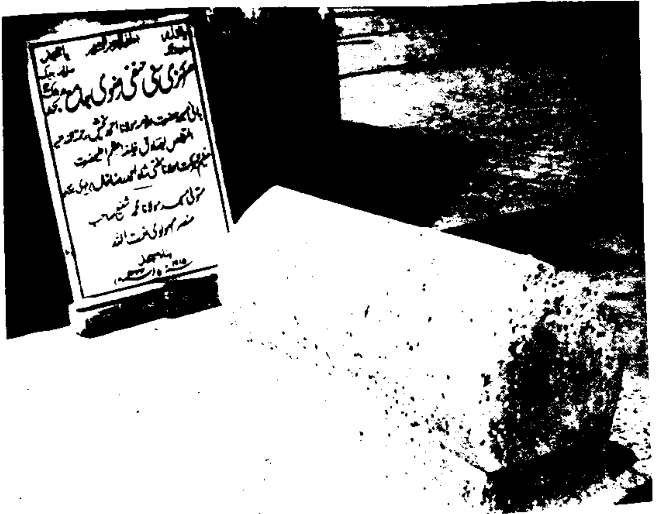
مزار مبارک 'مولانا احمد بخش صادق ڈیروی'