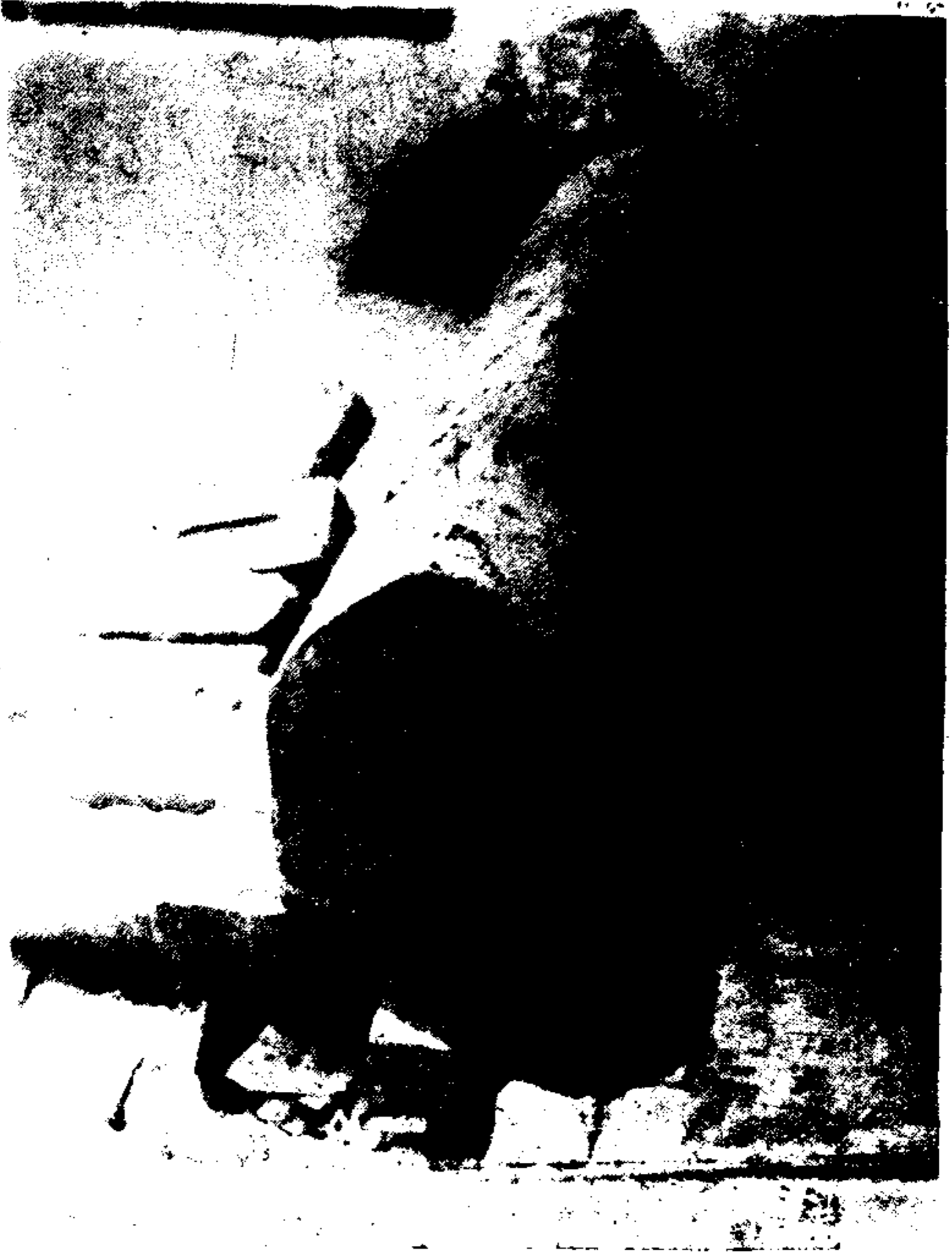
مولانا قاضی غلام یسین قادری ڈیروی کے مزار کا ایک منظر