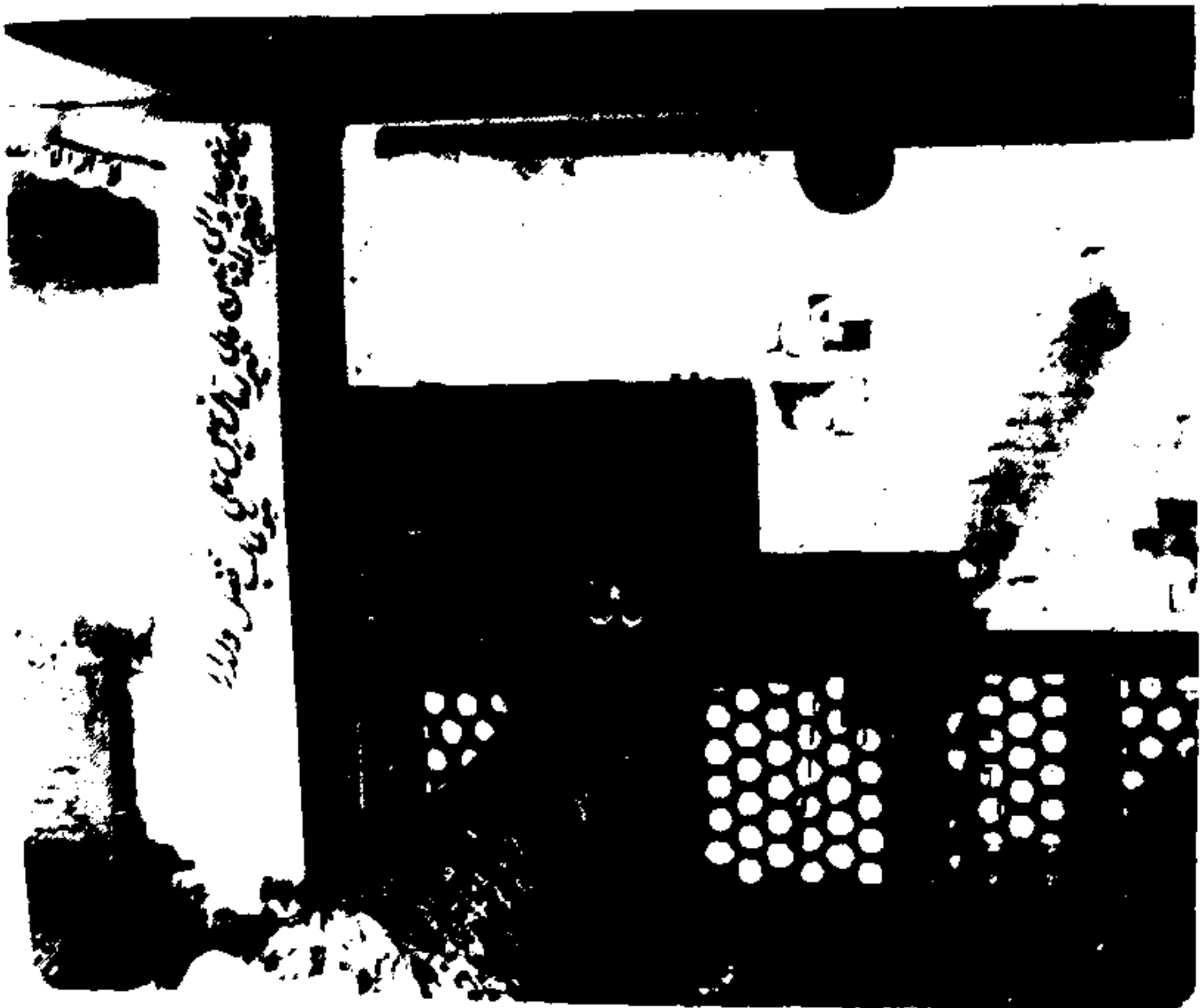
مولانا فضل حق چشتی سلیمانی ڈیروی کے مزار کا ایک منظر