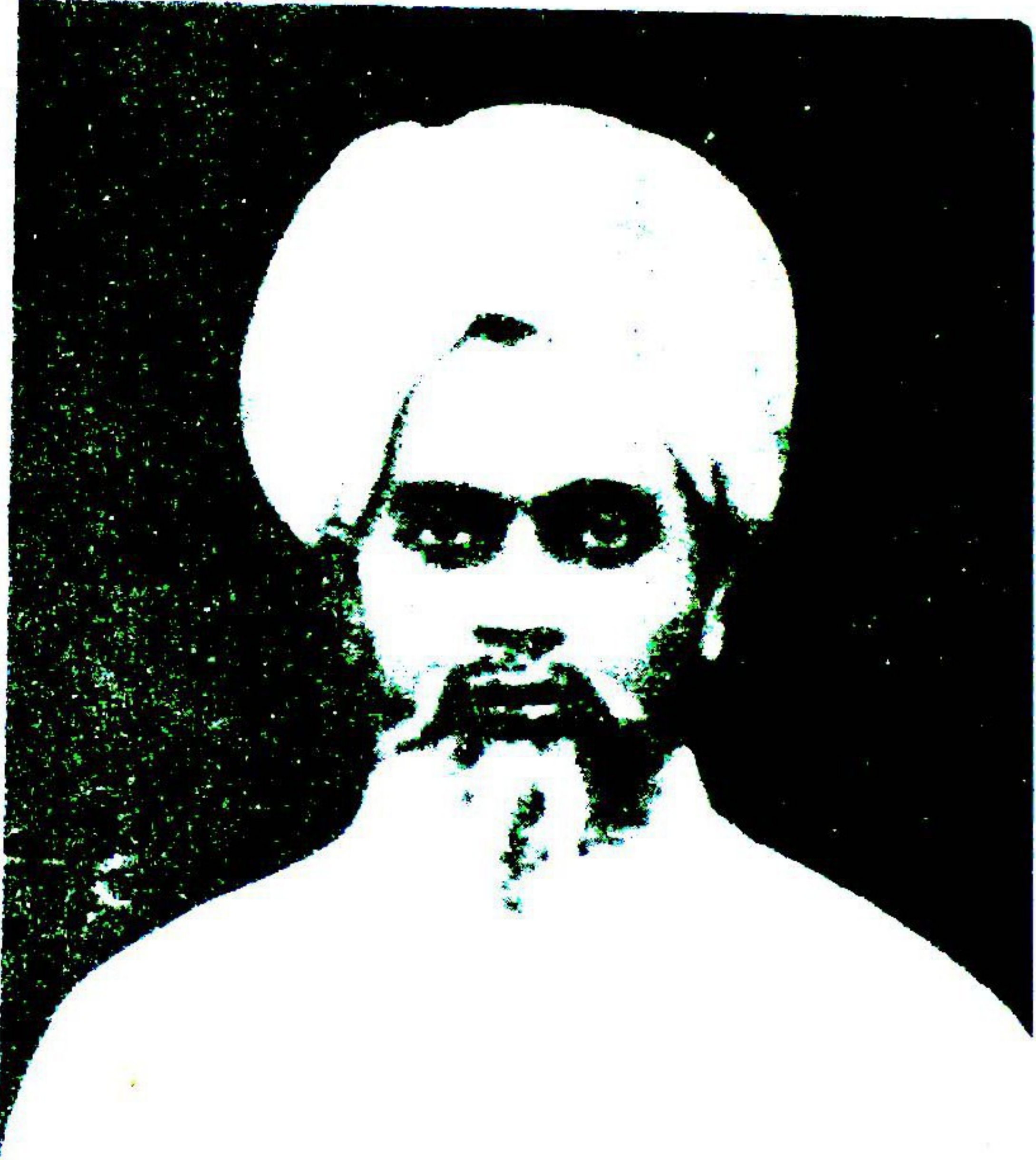
بانی کالج الہ آباد۔ علامہ حکیم احمد حسین عثمانی صاحب مرحوم