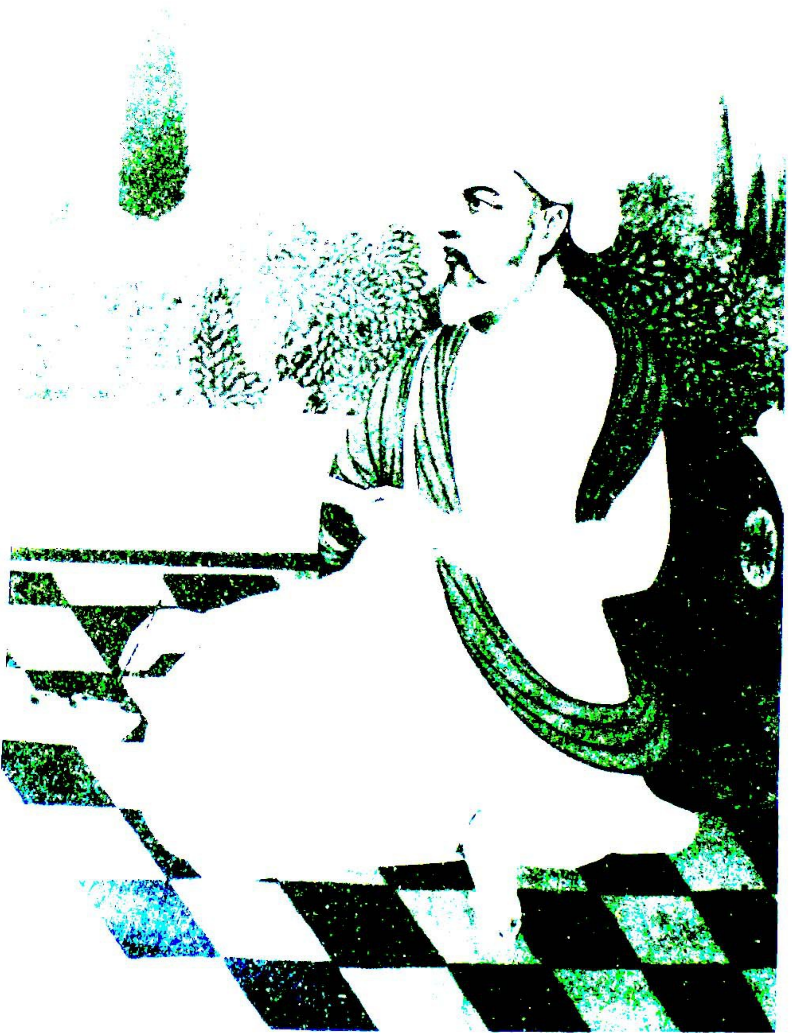
حکیم شریف خان یانی خاندان شریفی