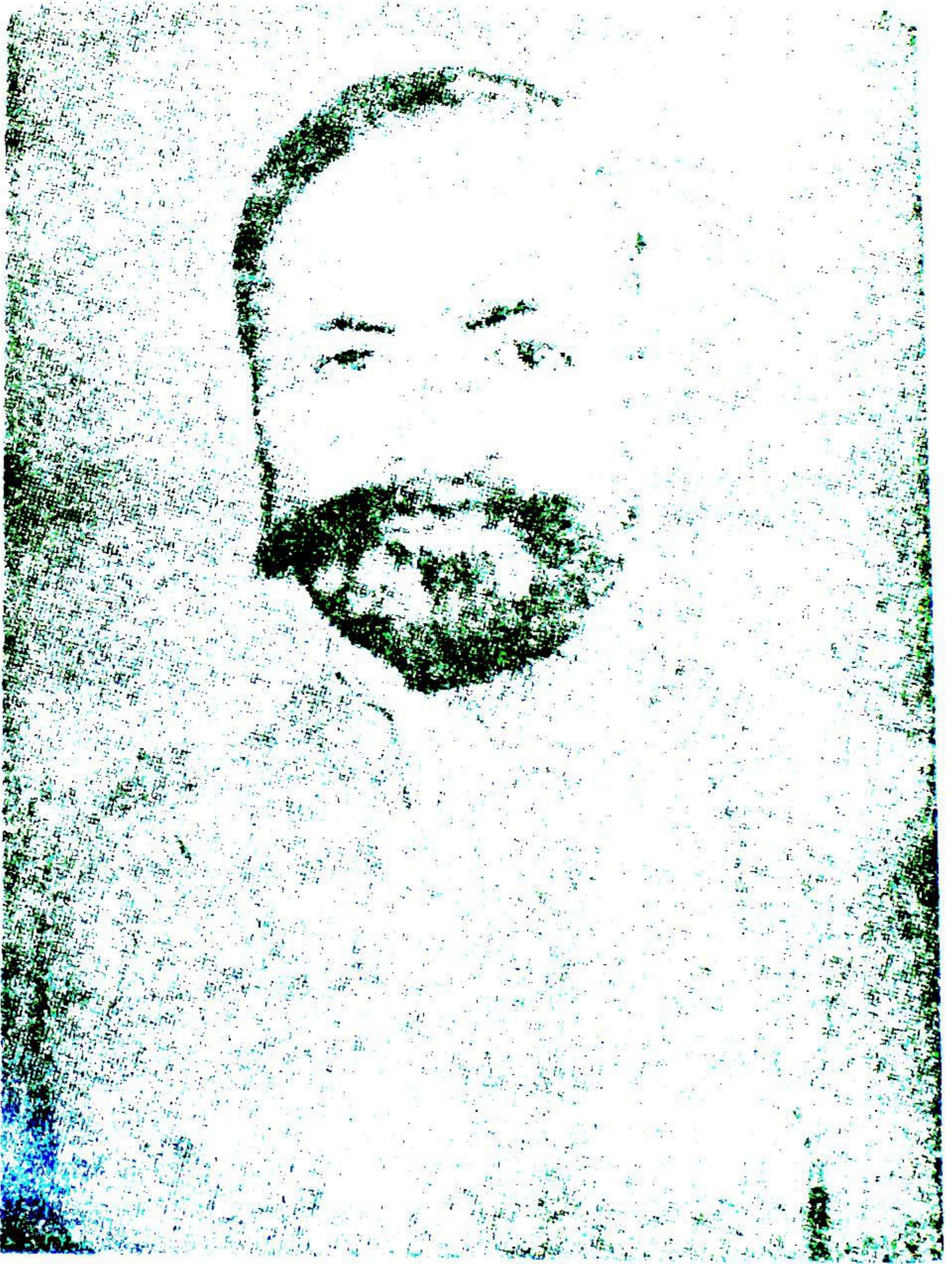
جناب سفیر المکابیر و فیصلہ علیہ عبد اللطیف فلسفی برائے