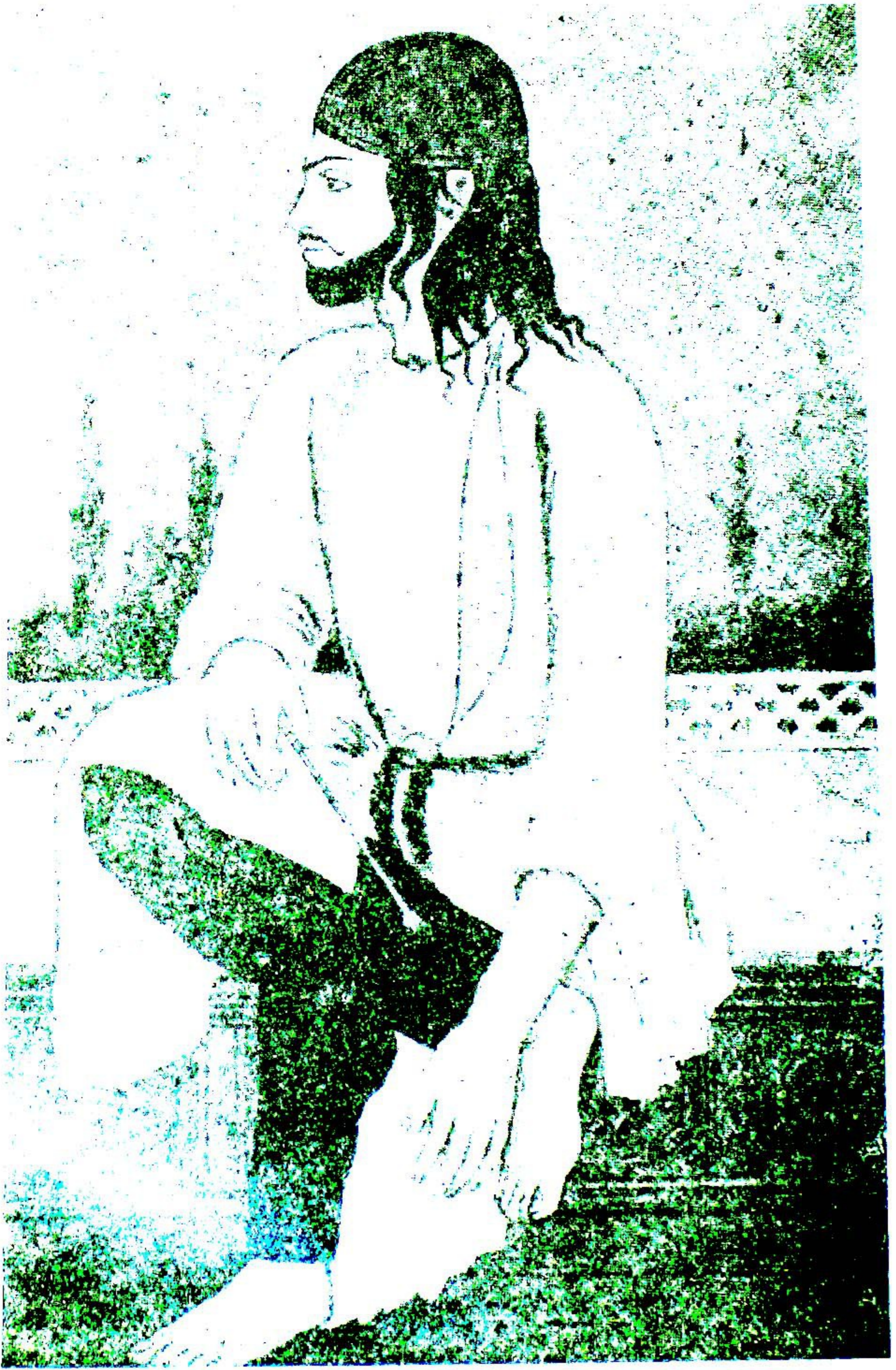
حکیم مومین خان مومین