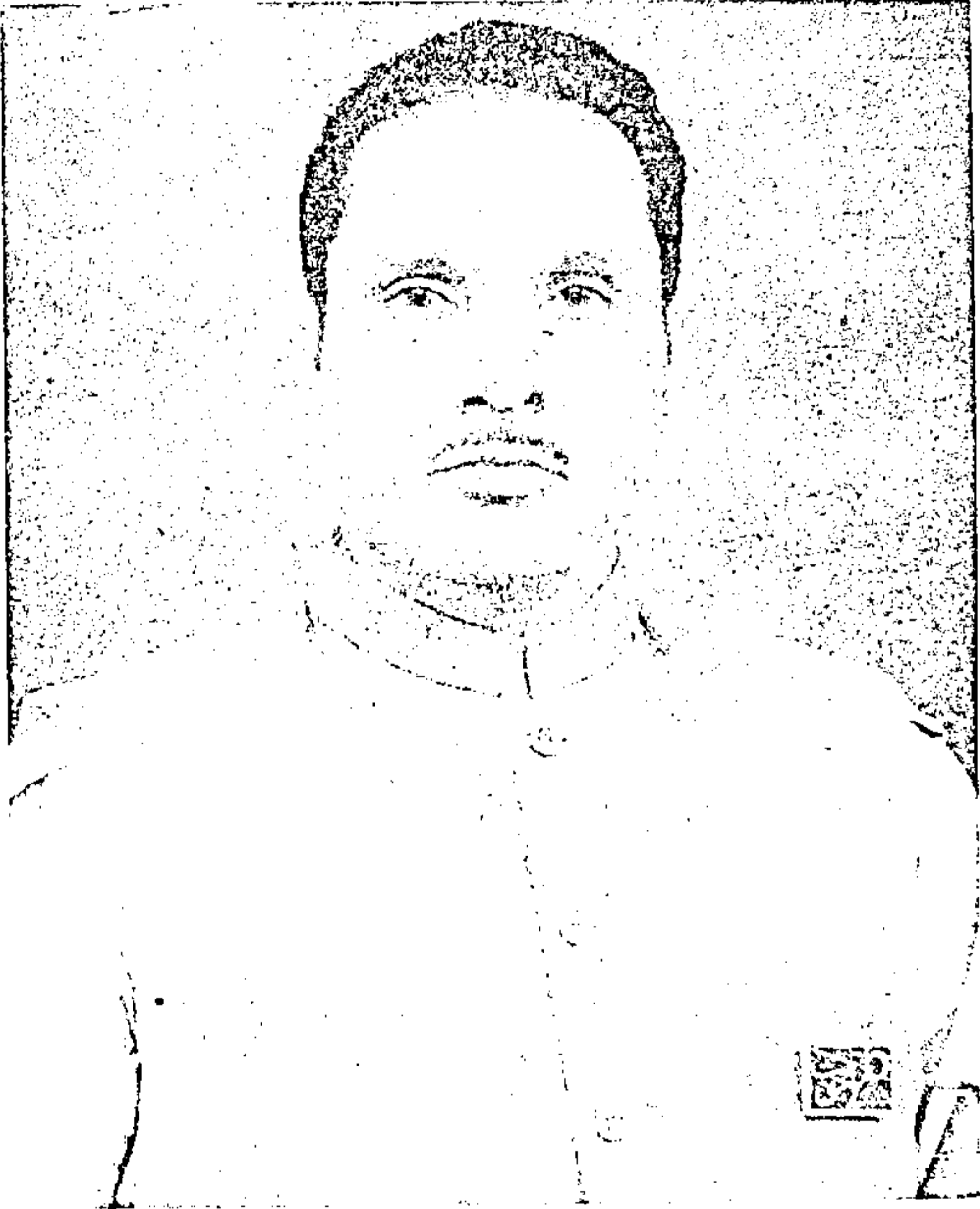
حمید الدین احمد المشرقی قائد خاکسار تحریک