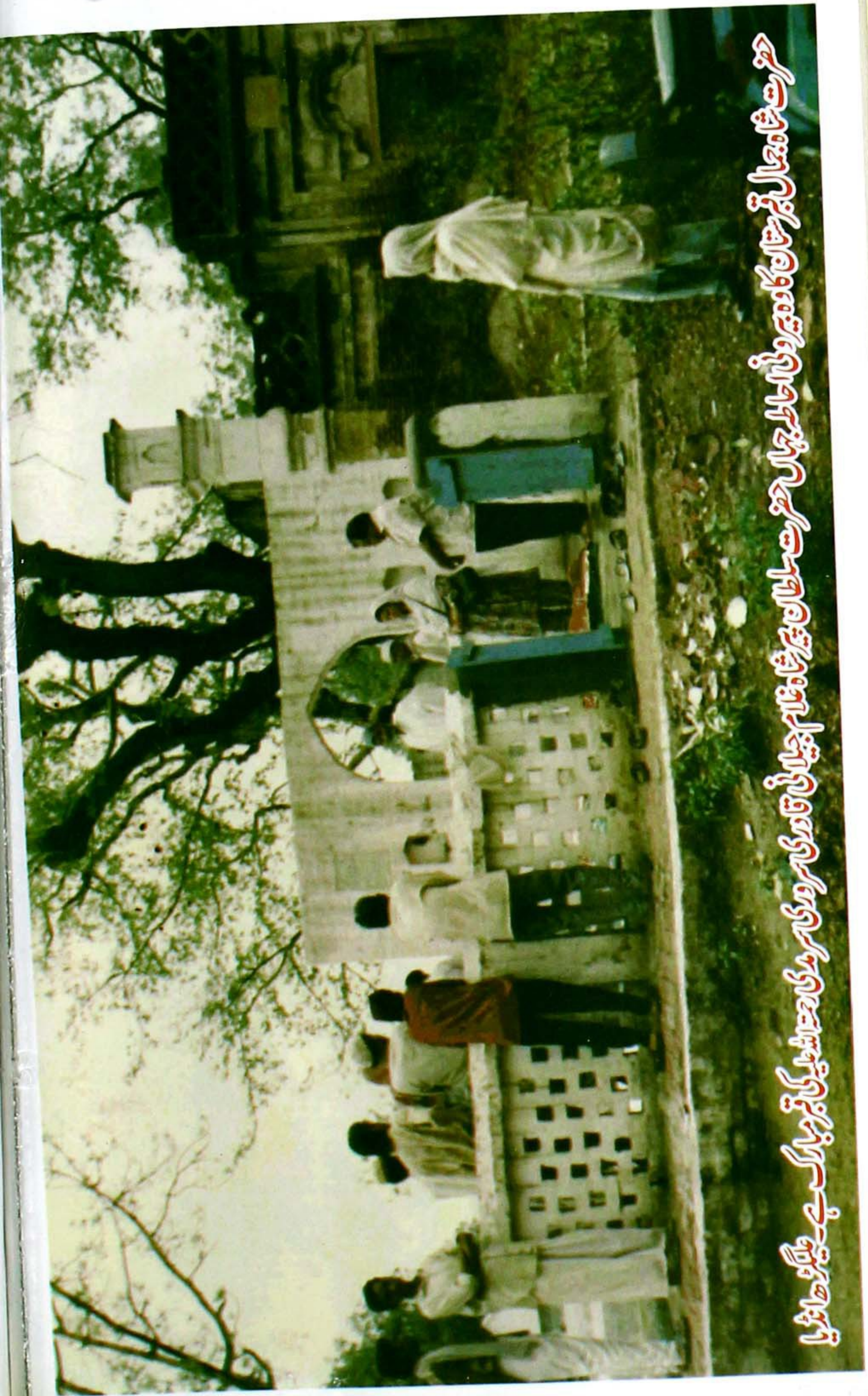
حضرت شہانہ جمال قبرستان کا وہیر و بی اے حاطہ جہاں حضرت سلطان پیر شاہ غلام حیدرانی قادری سرمدی سرمدی کی قبر ٹیبلٹ کی قبر مبارک ہے۔۔ عظیم و ماثریا