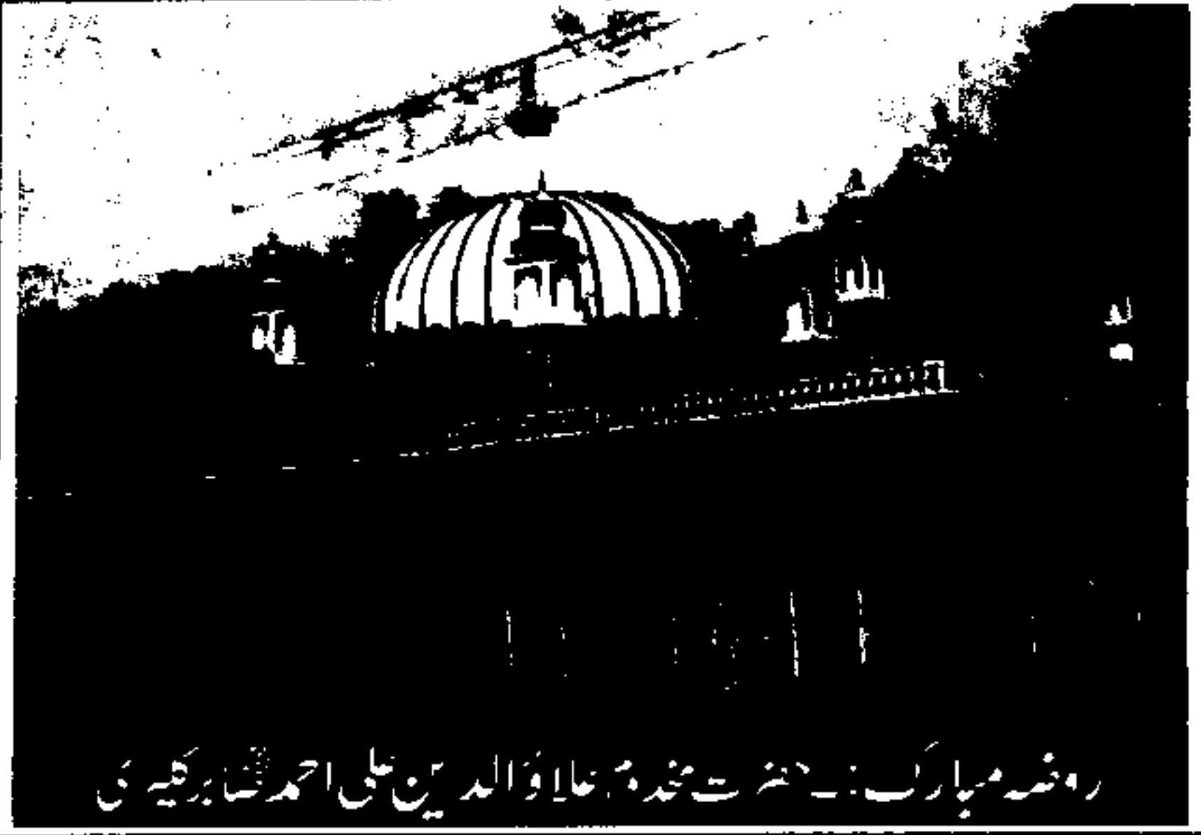
روضہ مبارک :- حضرت مجدد عالم والدین علی احمد شاہ برکاتی