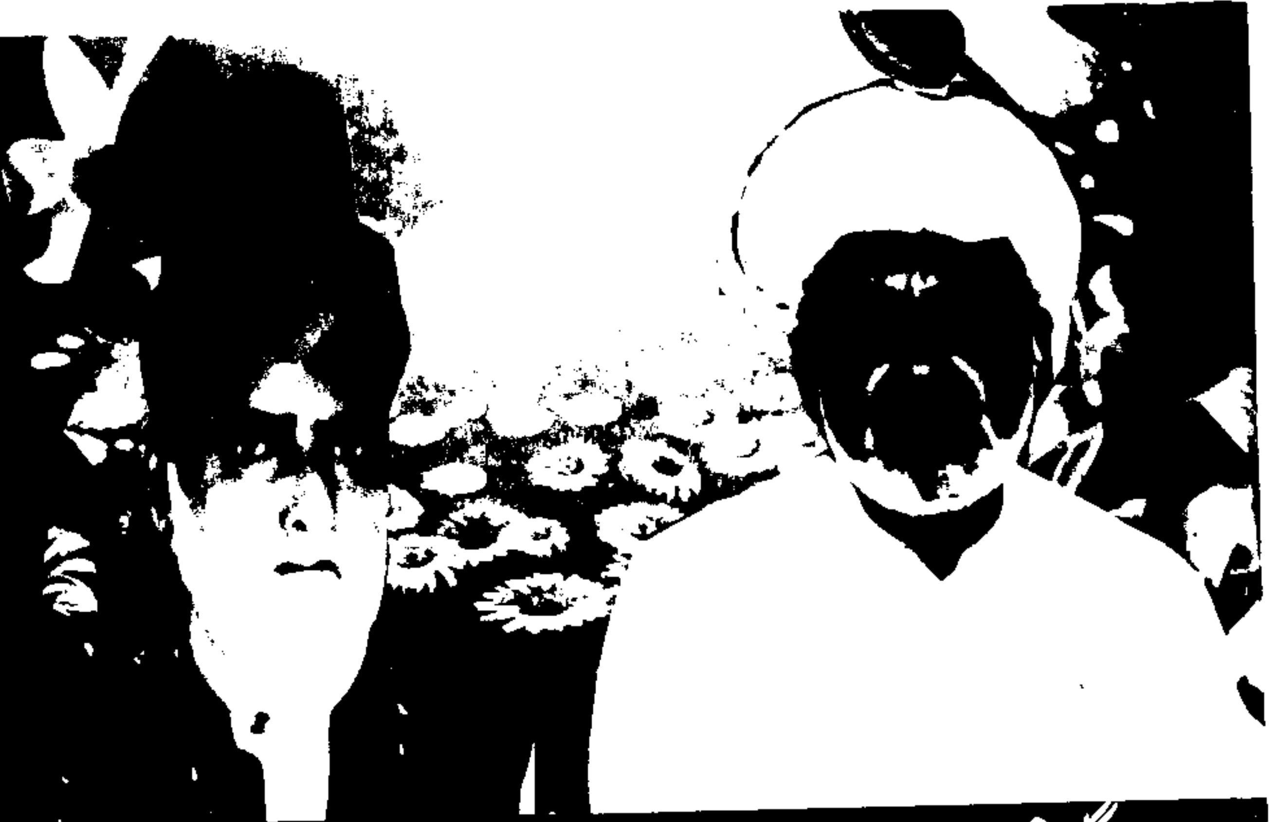
حضرت پیر گلزار حسینؒ شاہ صاحب صابری حضرت پیر میراںؒ شاہ صاحب صابری