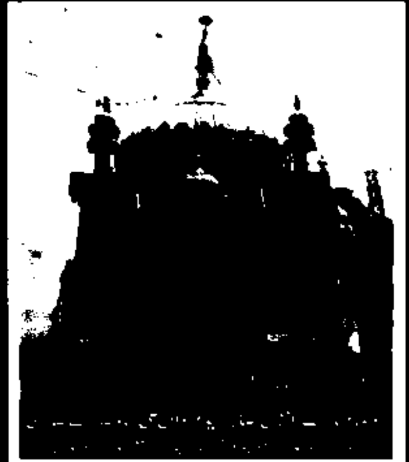
روضہ مبارک :- حضرت مجدد عالم والدین علی احمد شاہ برکاتی