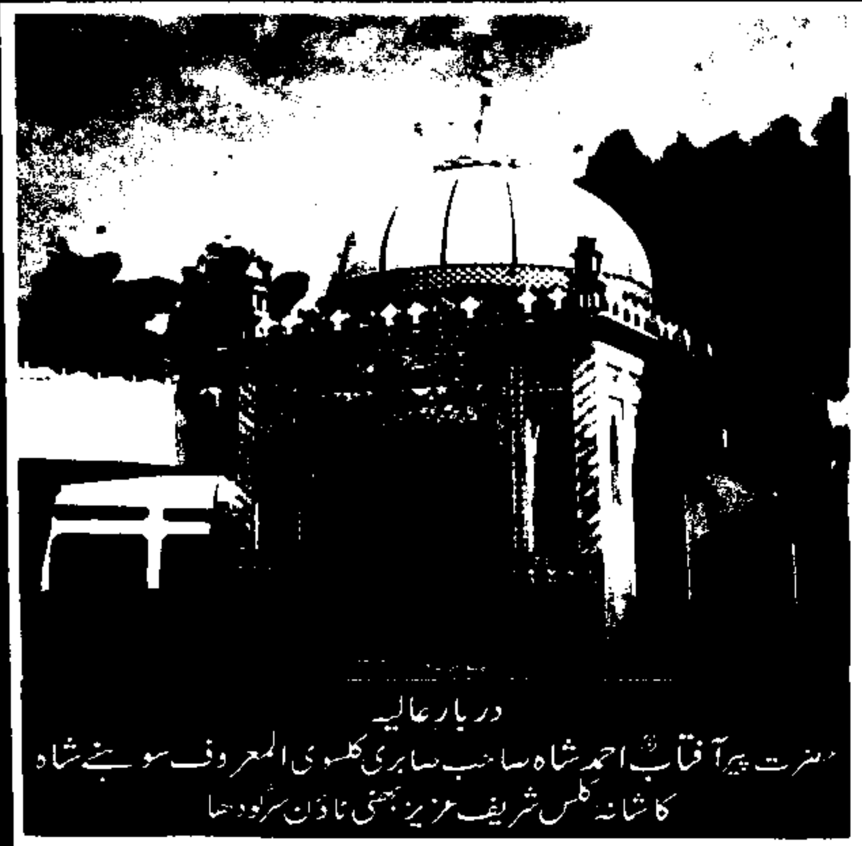
دربار عالیہ حضرت پیر آفتاب احمد شاہ صاحب ساہی کلسوی المعروف سونے شاہ کاشانہ کلس شریف عزیز یعنی ناڈان سرلودھا