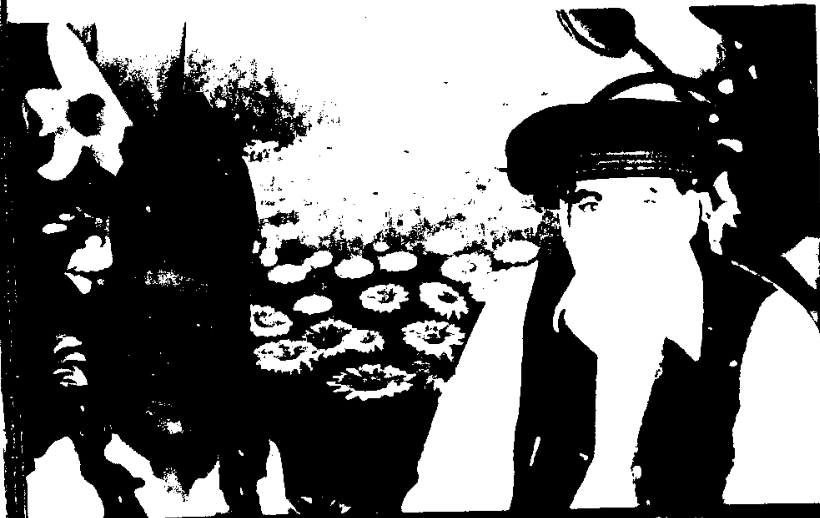
حضرت پیر آفتابؒ احمد شاہ صاحب صابری حضرت پیر چمنؒ شاہ صاحب صابری