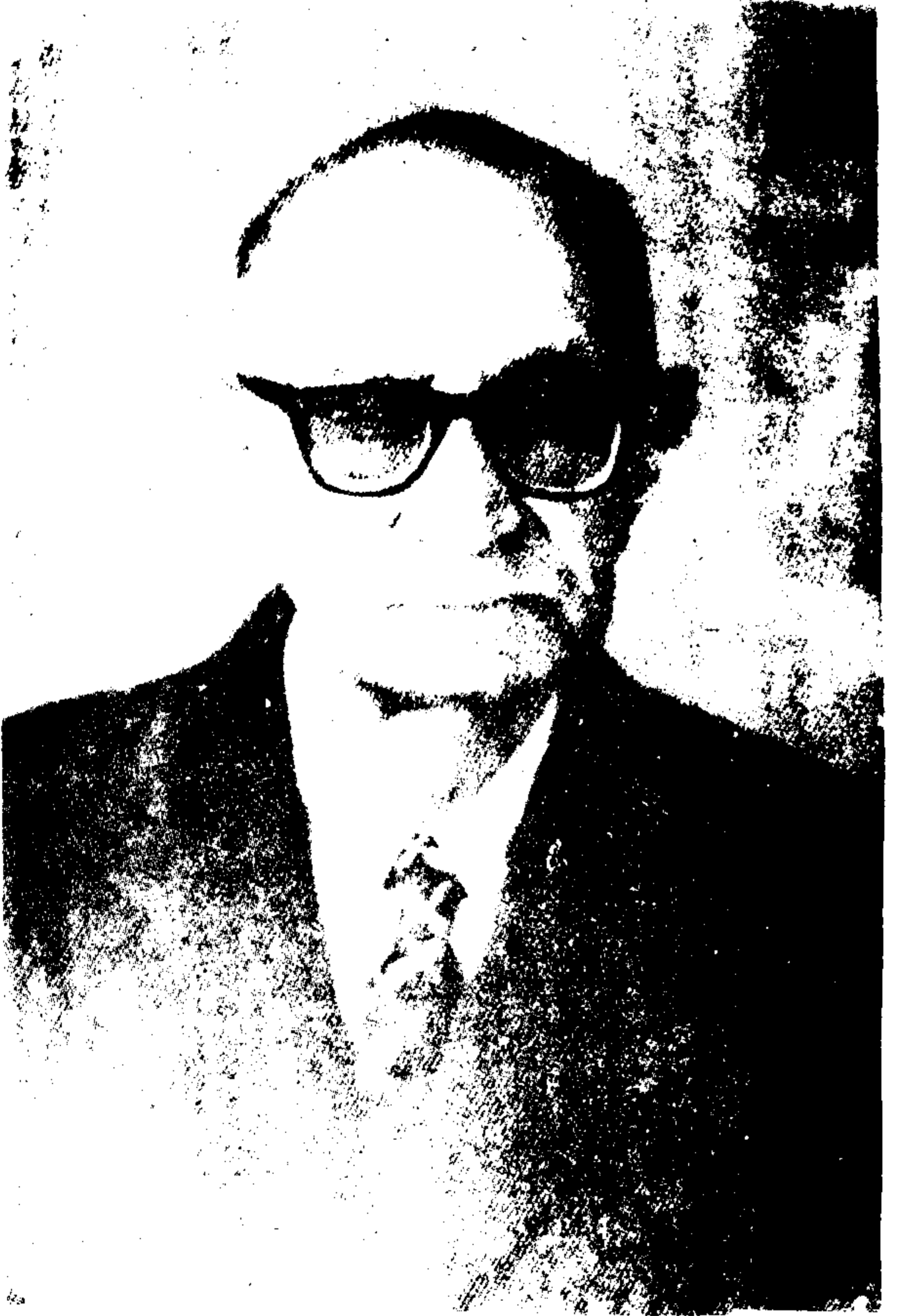
مصنف ڈاکٹر اقبال حسین