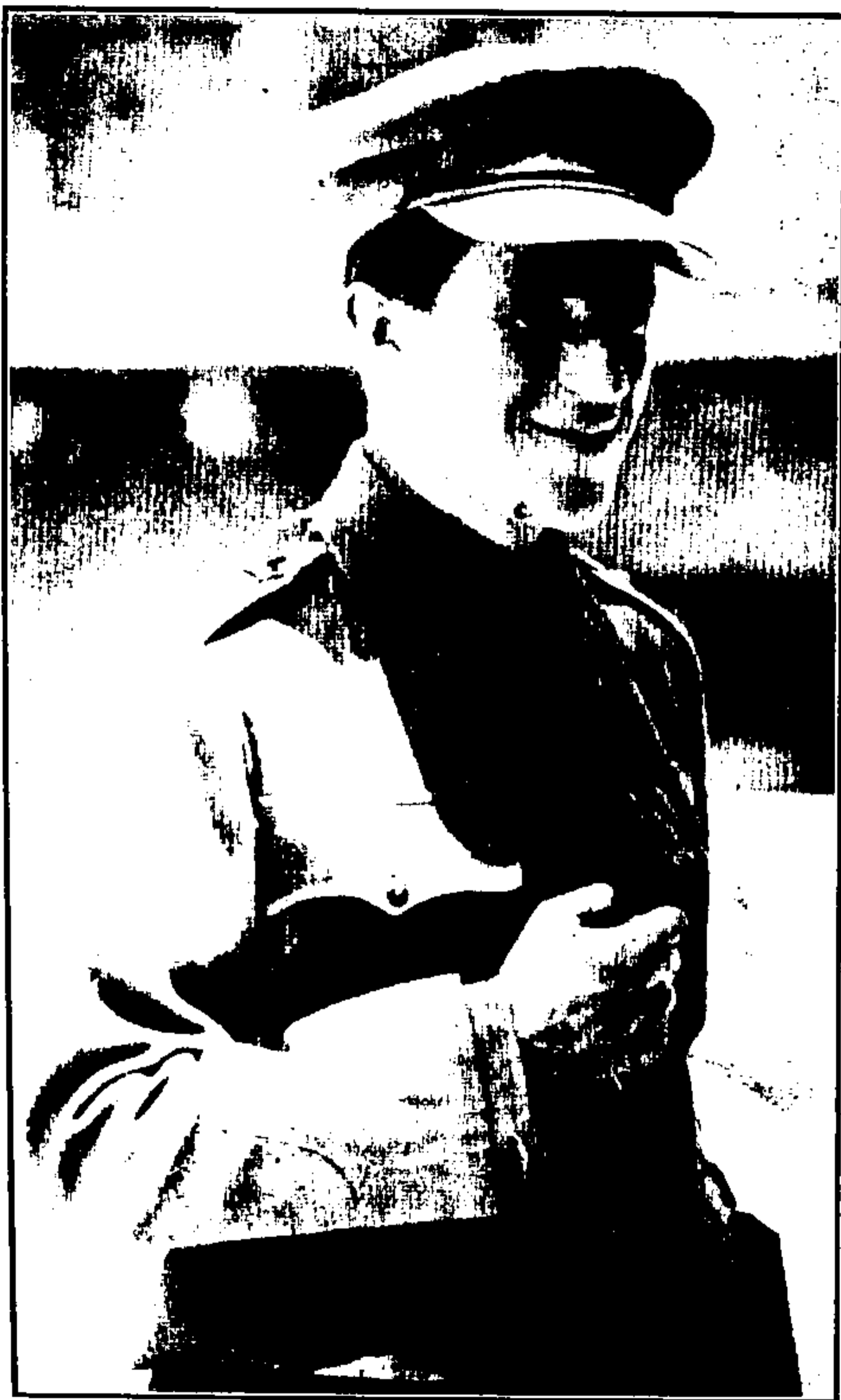
ڪرنيل لارنس فوجي ورلڊ ۾