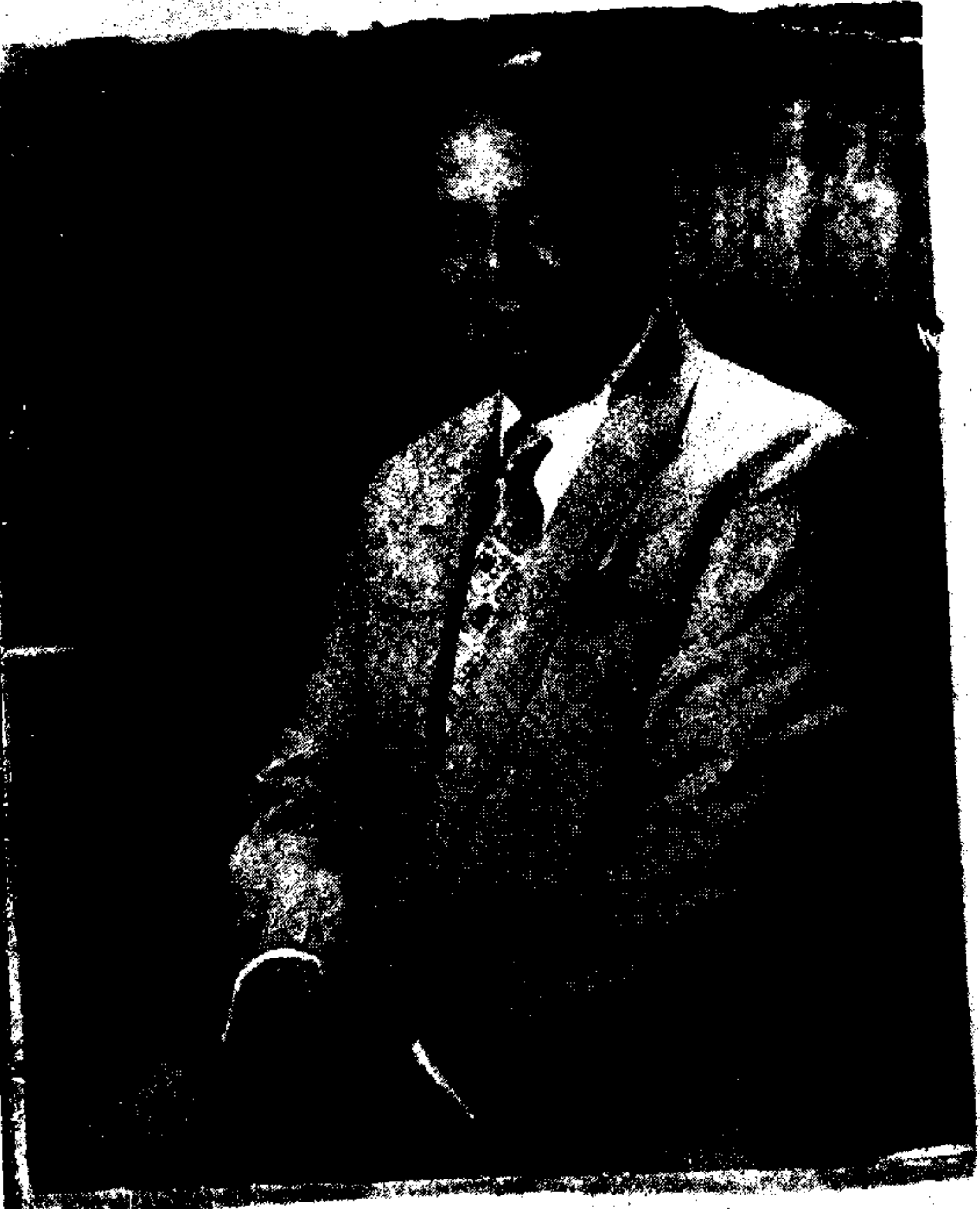
سابق وزیر اعظم پاکستان سید حسین شہید سہروردی رحمۃ اللہ علیہ