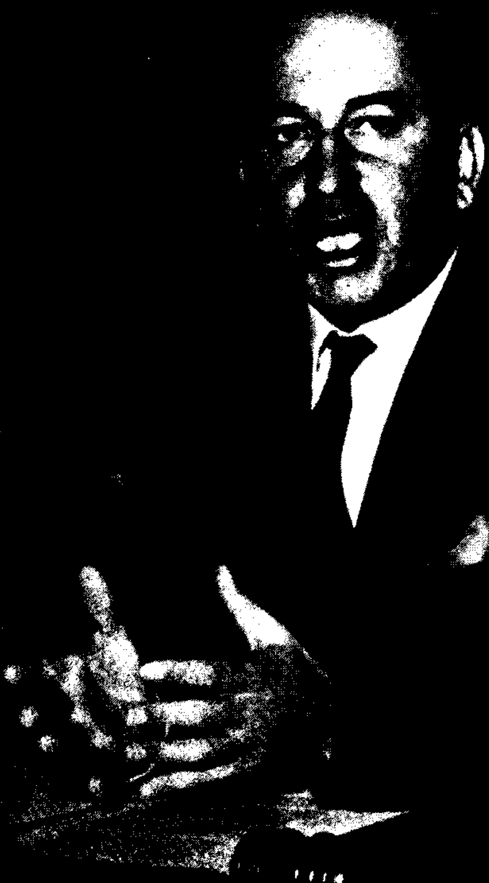
(NY25) UNITED NATIONS, N.Y., Sept. 29-(AP)-Pakistani Foreign Minister Zulfikar Ali Bhutto talks to newsmen at the United Nations headquarters in New York Wednesday. (AP)