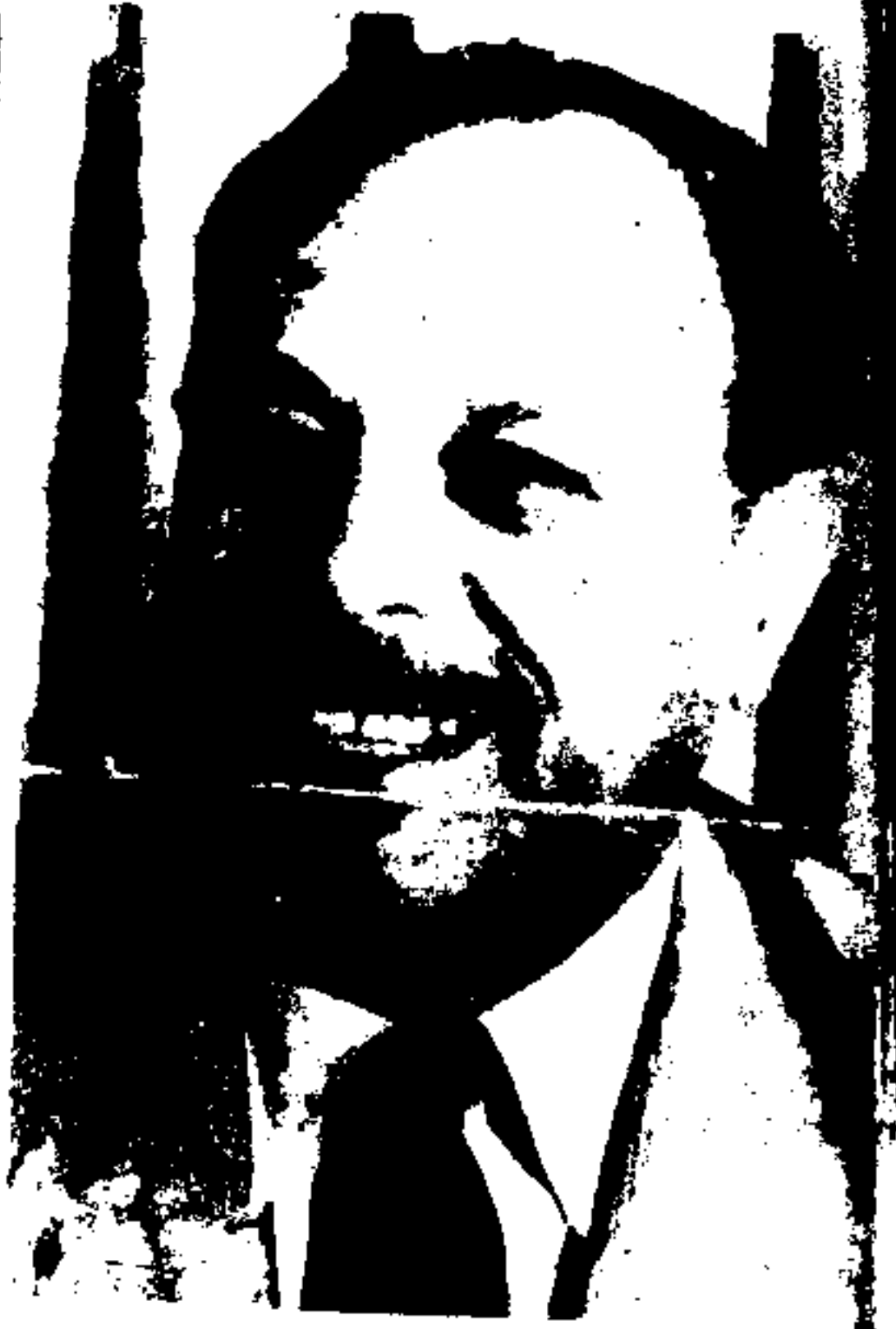
میرزا محمد ایوب خان