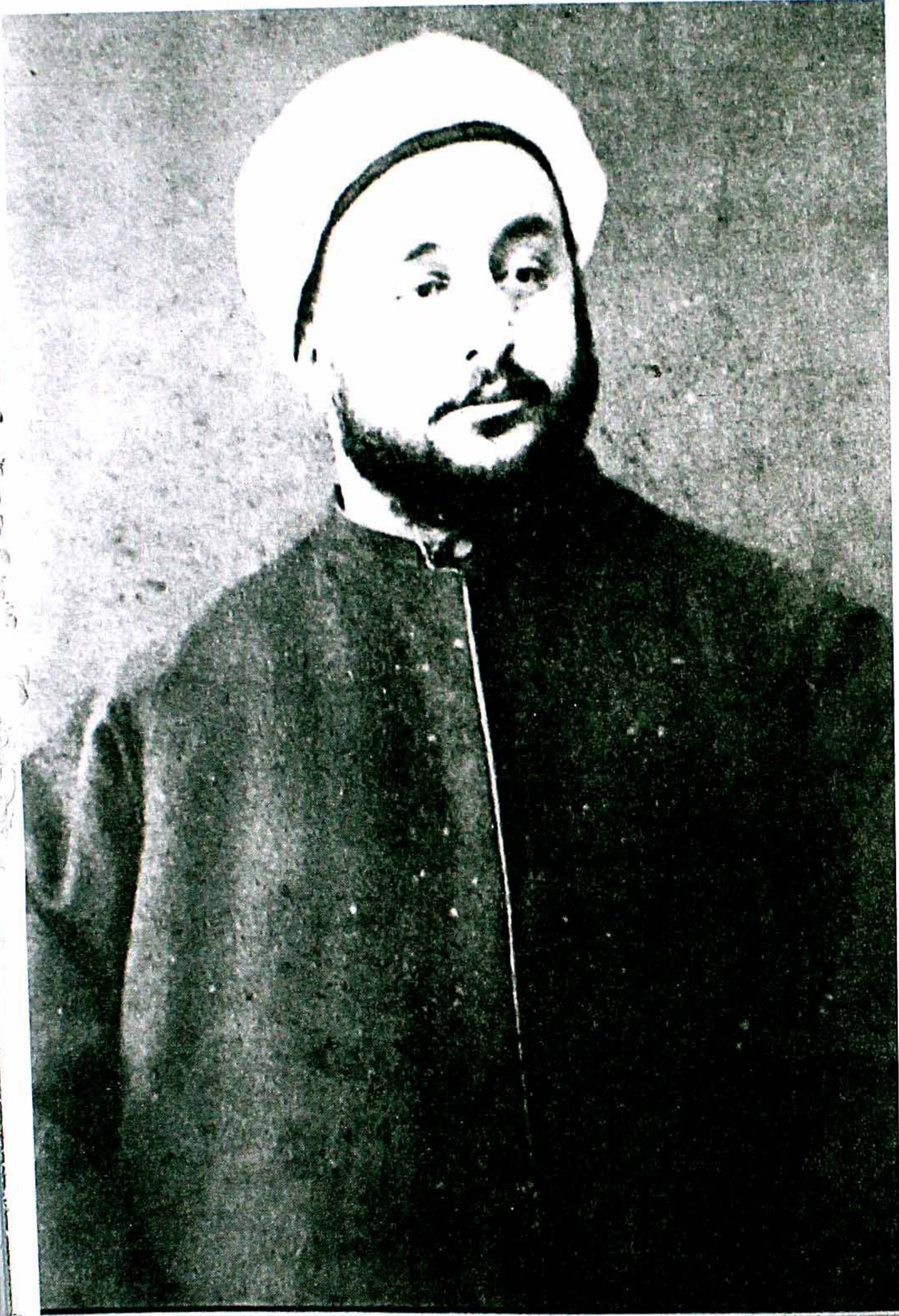
شیخ الاسلام عارف حکمت، مدینہ منورہ