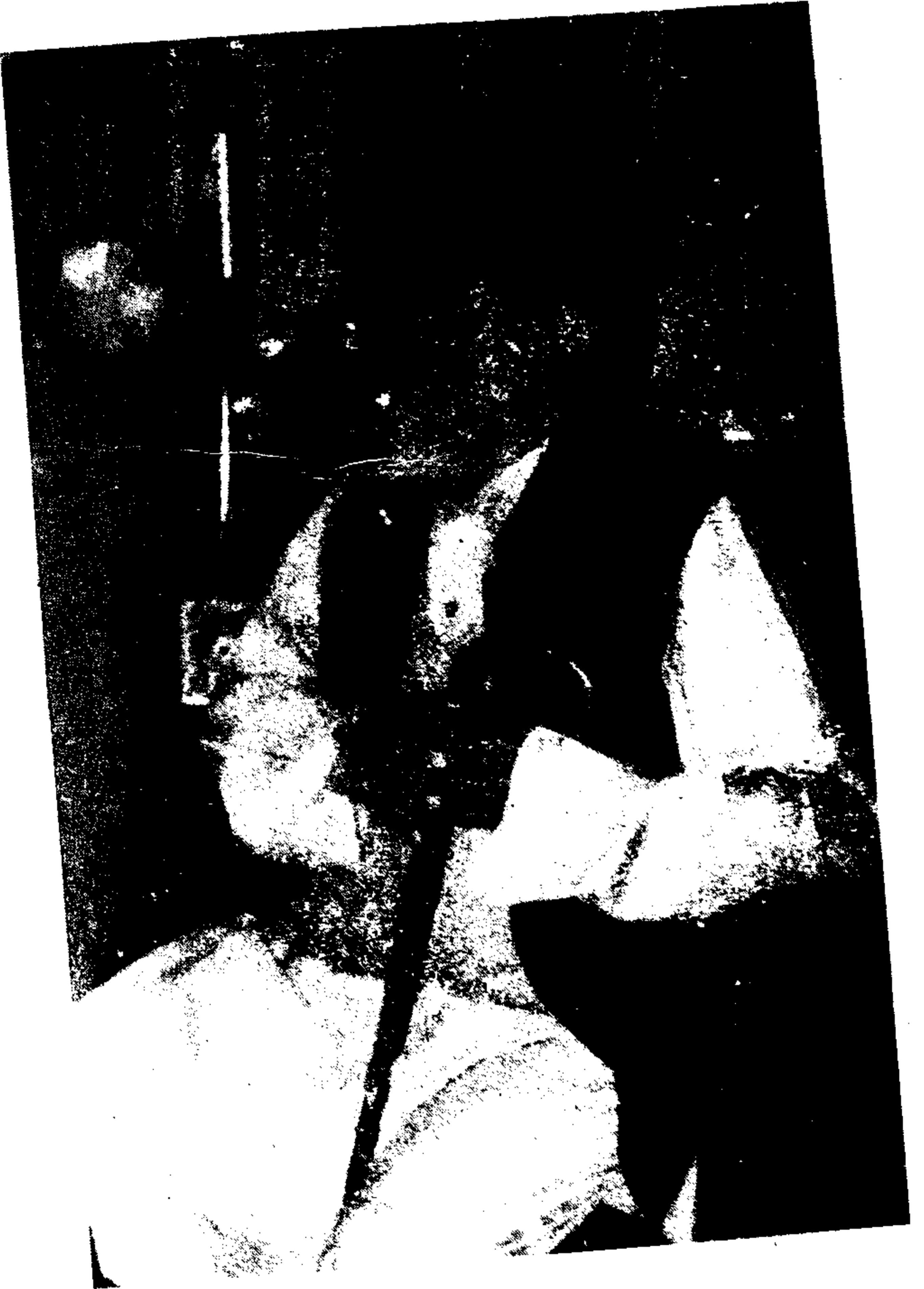
پروفیسر ڈاکٹر ڈاکٹر احمد حسین احمد قریشی قلعہ داری