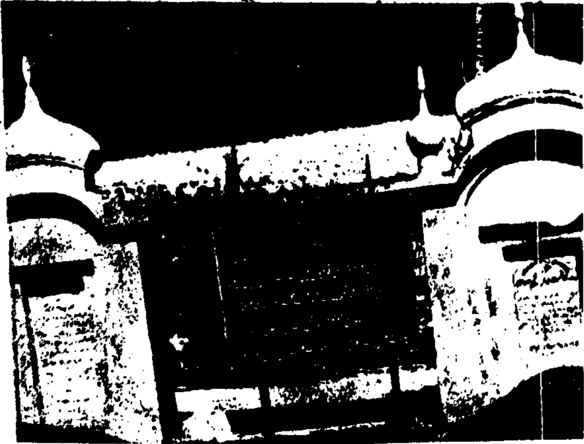
ارشاد حضرت محمود خلیفہ عانی رضی اللہ تعالیٰ عنہ

یہ امر قارئین کے لئے باعث تعجب ہوگا کہ قادیانی اپنے مردے پاکستان (ریوہ) میں اماٹاؤن کرتے ہیں۔ ان کا الہامی عقیدہ ہے کہ جلد یا بدیر اکھنڈ بھارت بنے گا۔ وہ اپنے مردے ہندوستان میں اپنے مرکز قادیان میں منتقل کریں گے۔ قادیانی جماعت کے سابق سربراہ مرزا بشیر الدین محمود کی مرگھٹ پر اب تک یہ کتبہ لگا رہا ہے۔